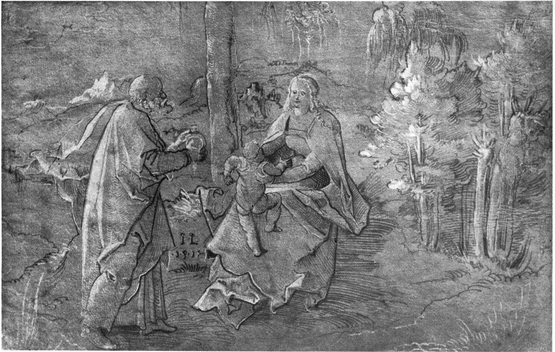
HL. FAMILIE. ROTTERDAM.