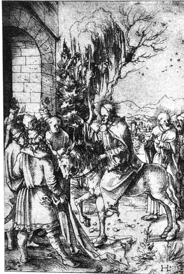
Abb. 19. Einzug Christi. Berlin.

Haben die letzten vier Zeichnungen eine ziemlich dicht geschlossene Gruppe gebildet, so steht der Einzug Christi in Jerusalem in Berlin (Maße 18,5 × 12,2 cm, Feder) (Abb. 19) etwas abseits 1) . Er muß gegen Ende des Jahres 1517 entstanden sein, denn eine deutlich bemerkbare Veränderung liegt zwischen diesem Palmsonntagsbild und den frühern Blättern. In den breiten, rundschildigen Kopftypen, dem festern Strich und der weitergetriebenen Auflösung des Konturs