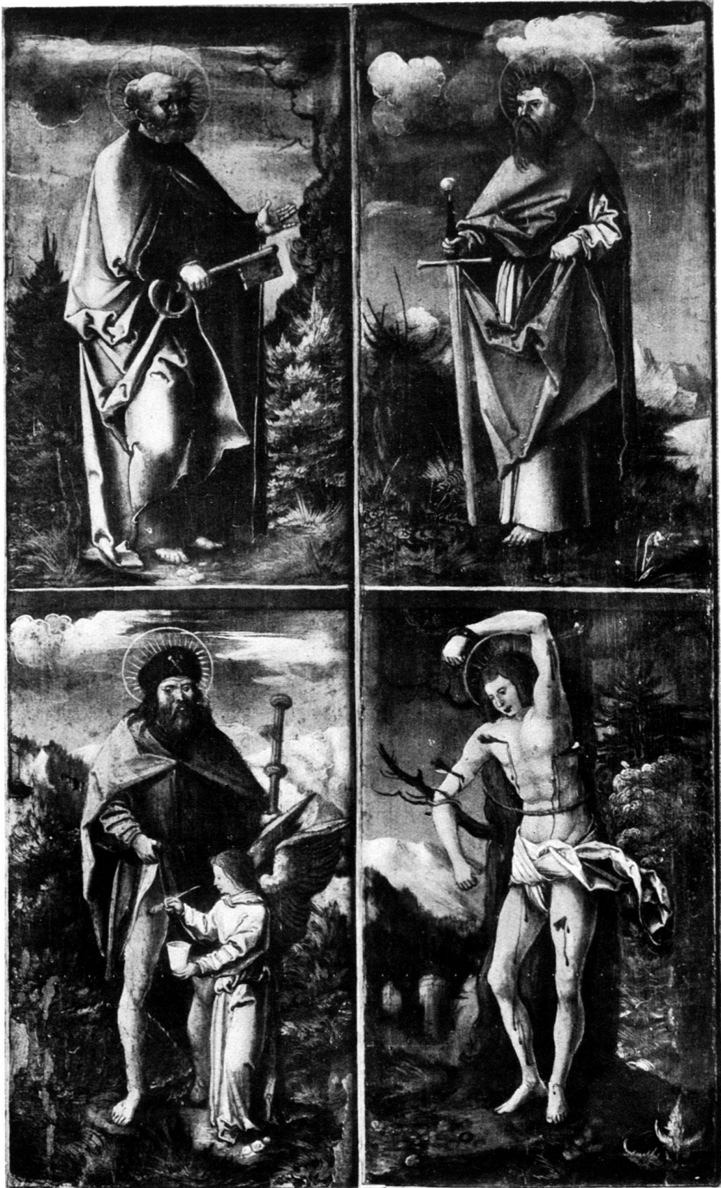
REISEALTÄRCHEN (geöffnet, ohne Mittelstück). Zürich, Landesmuseum.