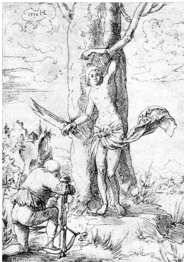
Abb. 17. Hl. Sebastian. Nürnberg.

Die dritte Zeichnung dieses Jahres, der hl. Sebastian im Germanischen Museum in Nürnberg (Abb. 17), ist mit Recht wohl die bekannteste des Zürcher Meisters 1) . Sie ist von seinen Figurenzeichnungen mit die gelungenste; sie hat ausschlaggebend mitgewirkt bei der Bildung unserer bisherigen Vorstellung von der