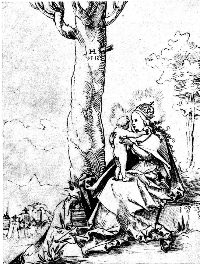
Abb. 18. Madonna mit Kind. Basel.

der Binnenfalten. Von der Landschaft aber, die bezeichnenderweise die Figuren umgibt und ausschlaggebend beim Gesamteindruck mitwirkt, läßt sich kein tadelndes Wort sagen. Sie bildet den weitaus gelungensten und erfreulichsten Teil. Da ist unmittelbares, warmes Leben, persönlich gesehen und mit Geschick wiedergegeben. Zerzauste Bäume, knorrige Äste, lichtglänzende Zweige recken sich in die feuchte Luft. Und in der Malerei des Sees, der schneebedeckten Berge und des Himmels darüber wird sogar versucht, dem ganzen atmosphärischen