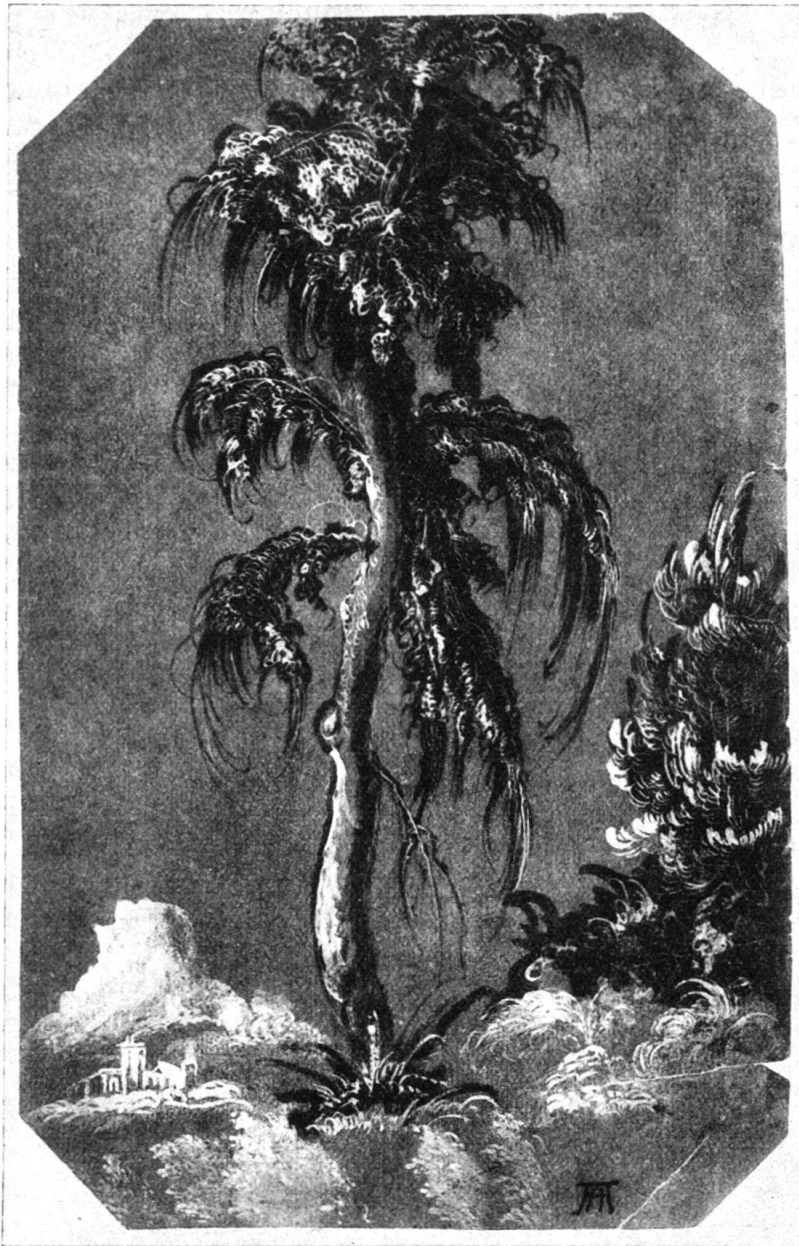
Abb. 20. «Baum». Dessau.

gemachten «œuvre» sind aber so eng, daß auch ein Hinweis auf die höhere Qualität des Blattes, das seinen Wert nicht zuletzt einem glücklichen Zufall verdankt, nicht vermag, den «großen Baum» aus der Liste der Werke Leus