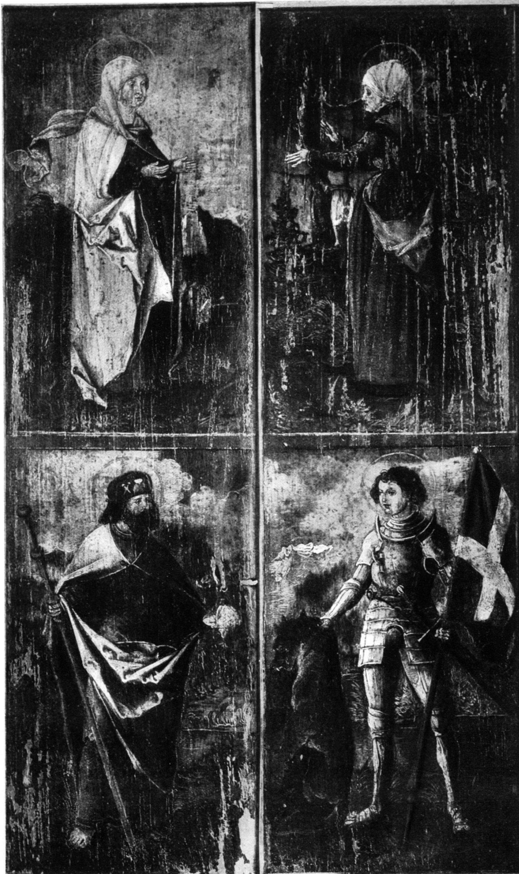
REISEALTÄRCHEN (geschlossen). Zürich, Landesmuseum.