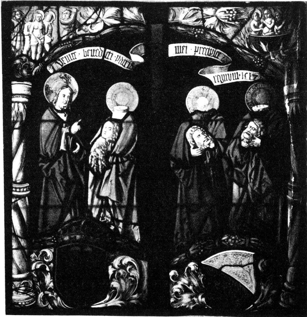
Abb. 15. Standesscheibe mit den Zürcher Stadtheiligen. Nürnberg.

schließen. Trotz vieler abweichender Veränderungen ist es nämlich doch wahrscheinlich, daß die prachtvolle Standesscheibe auf den Leuschen Riß zurückgeht. Die Platzverhältnisse mochten verlangen, die Ausführung mehr in die Breite zu ziehen, wodurch die Zweiteilung eintreten mußte. Deshalb kam das dünne umrahmende Ästchen dem standfestern Glasmaler auch gar zu leicht und