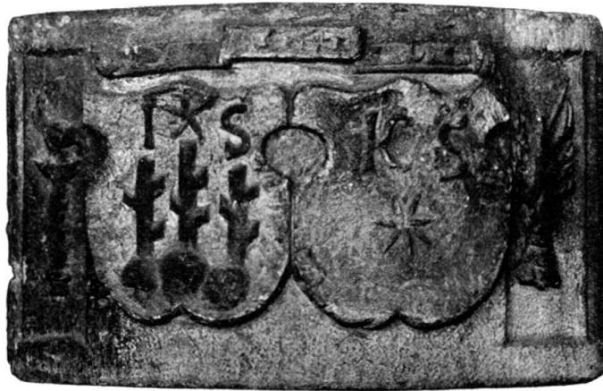
Abb. 1. Allianzschilde Stockalper-Sigristen. Vom Specksteinofen von 1549 aus Brig im Schweiz. Landesmuseum.

In der Mittelschweiz, d. h. in allen Hochtälern rings um das Massiv des St. Gotthard, werden seit Jahrhunderten die Öfen aus Speck- oder Ölstein gebaut; das Material hat deshalb vielfach auch den Namen Ofenstein erhalten. Er beherrscht die Herstellung der Heizkörper in so ausschließlichem Grade, daß uns alte Öfen aus Thon in den vorgenannten Gegenden noch niemals zu Gesichte gekommen sind. Der Stein ist grünlich, dunkelgrau und fettig und wird im Lauf der Zeit schwarz. Die Gestalt der Öfen ist sich durch Jahrhunderte gleich geblieben: es handelt sich