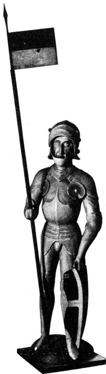
Abb. 2. St. Ursus vom ehemaligen Wassertor.

Auf der Ostseite bildete den Endpunkt der Vorstadtbefestigung an der Aare ein viereckiger Turm, der auf dem Stadtprospekt als kleiner Pulverturm bezeichnet wird. Er scheint derjenige gewesen zu sein, von welchem Franz Haffner