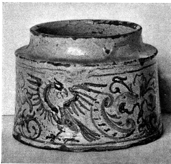
Abb. 5. Dose aus Zug. (Zürich, Landesmuseum.)

Die zu der zweiten Gruppe gehörenden Stücke, die wir ebenfalls noch mit Unterstützung des Herrn Scheuchzer verifizieren konnten, sind leider sehr zerstört. Nur zwei derselben erhielten nach dem Zusammenstücken der Fragmente ihre ursprüngliche Form. Die vier übrigen sind nur zur Hälfte oder zu zwei Dritteln vorhanden. Die Grundform aller ist die gleiche wie bei der im Landesmuseum aufbewahrten Lisene mit dem vertieften Mittelfeld (siehe Abb. 1) 1) . Das Ornament dagegen ist verschieden.