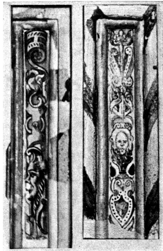
Abb. 4. Lisenen aus der Umgegend von Altdorf. (Basel, Gewerbemuseum.)