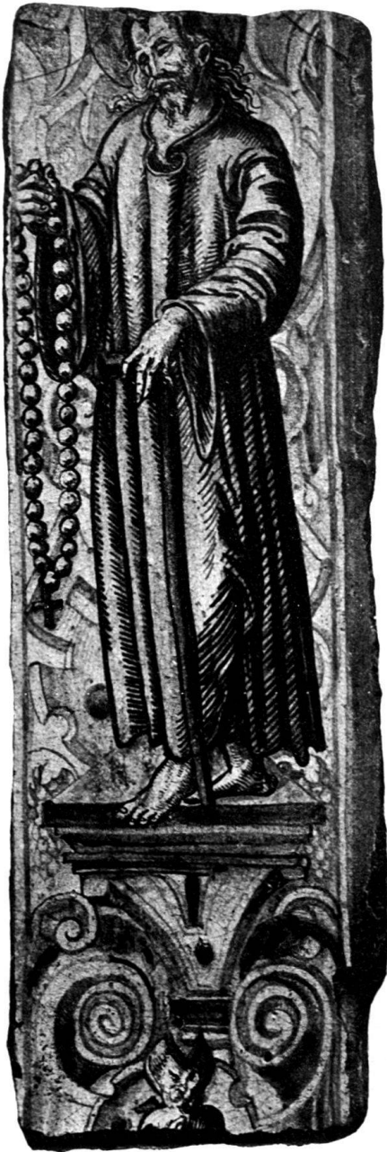
Abb. 3. Bruder Klaus-Lisene aus Hergiswil.

Als die ins Basler Gewerbemuseum gekommene Lisene bezeichnete uns Herr Scheuchzer