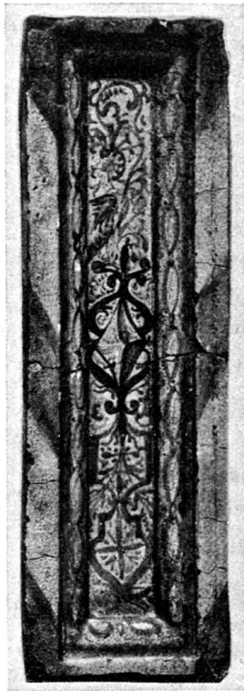
Abb. 1. Lisene. Schweiz. Landesmuseum (S. 103, No. 20).

Grün und Manganviolett. Gelb ist spärlich verwendet und wie Grün nur als Lokaltön, der zufolge der bläulich oder violett durchschimmernden Zeichnung gerne eine grünliche oder olivfarbene Tönung annimmt. Im allgemeinen kann gesagt werden, daß die Zeichnung des Rollwerkes wie auch der Schriftbänder und Wolken samt den die Darstellungen umschließenden Rahmen und den Seitenflächen der Kachelpplatten blau gehalten ist. Manganviolett kommt vor in den Fleischteilen, Architekturen und Schriften, Grün und Gelb wie oben