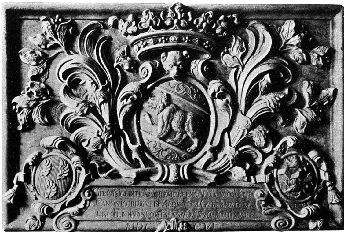
Abb. 1. Gedenktafel aus der Kirche von Zofingen in der städtischen Sammlung.

empfundenen Platzbedürfnis suchte man 1604 durch den Bau einer Empore zu begegnen. Hundert Jahre später wurden die Raumverhältnisse unhaltbar, namentlich als der neue Stiftsschaffner, Ferdinand von Diesbach, den Taufstein, der zuvor im Chor gestanden hatte, vor den Lettner ins Querhaus stellen ließ. Dem Übel suchte man zunächst dadurch abzuhelpen, daß in die geschlossene Lettnerwand zwei große Bogenöffnungen gebrochen wurden, die den Blick vom Chor nach der Kanzel ermöglichten. Die Bauern der Außengemeinden, welche nun angewiesen wurden, sich ins Chor zu setzen, weigerten sich dessen, da die ungünstige Akustik das Verstehen der Predigt unmöglich machte. Sie legten