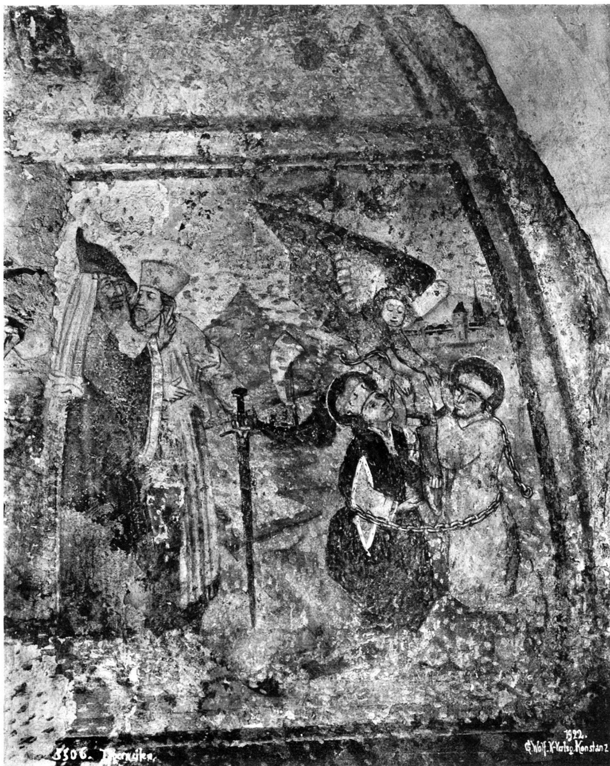
Darstellung aus dem Martyrium der Heiligen Cosmas und Damian.