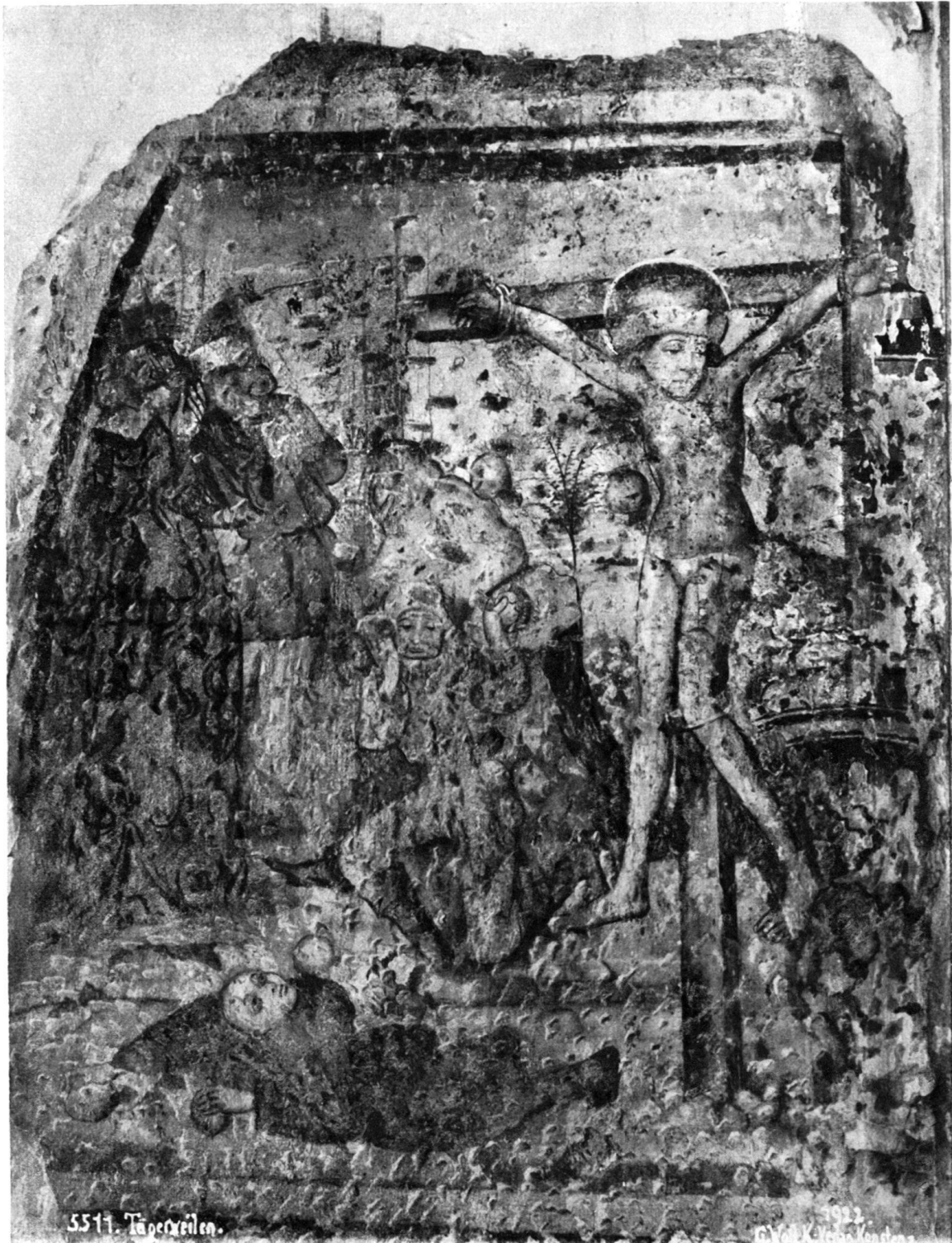
Darstellung aus dem Martyrium der Heiligen Cosmas und Damian.