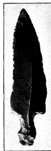
Abb. 18. Feuersteinlanzenspitze v. Buonas. 1 : 2. Sammlung Grimmer.

Nach einer Mitteilung von Herrn M. Speck 1) hat auch bei diesem Pfahlbau der Sturm vom 4./5. Januar 1919 wieder neue Teile bloßgelegt: „Gegenwärtig sieht man am Ufer unter den Wurzeln eines Baumes einen Querbalken und mächtige Pfähle“. — Im Frühling 1920 sammelten die Herren Speck 2) am Ufer 16 gekerbte Steinplättchen, 10 Serpentinbeile vom Dicknacktypus, einige Silexlamellen und verschiedene andere Steinartefakte, ferner eine 11 cm lange Ahle aus Hirschhorn.