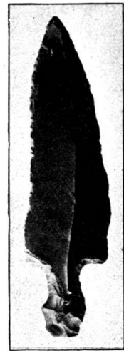
Abb. 18. Feuersteinlanzenspitze v. Buonas. 1 : 2. Sammlung Grimmer.

Nach einer Mitteilung von Herrn M. Speck 1) hat auch bei diesem Pfahlbau der Sturm vom 4./5. Januar 1919 wieder neue Teile bloßgelegt: „Gegenwärtig sieht man am Ufer unter den Wurzeln eines Baumes einen Querbalken und mächtige Pfähle“. — Im Frühling 1920 sammelten die Herren Speck 2) am Ufer 16 gekerbte Steinplättchen, 10 Serpentinbeile vom Dicknacktypus, einige Silexlamellen und verschiedene andere Steinartefakte, ferner eine 11 cm lange Ahle aus Hirschhorn.