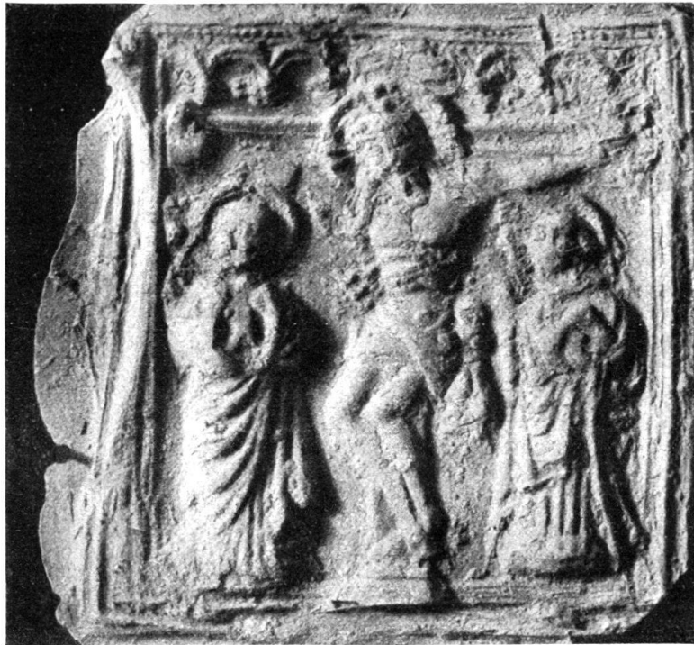
Kreuzigung, Relief auf einer Glocke von 1560, Olten. (Nat. Gr.)