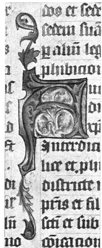
Abb. 5 b

Kopie einzelner in den farbigen Zierinitialen verwendeten Blattformen. 2. Farbige Zierinitialen von der gleichen Hand wie diejenigen im I. Bande.