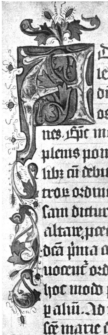
Abb. 5 a

Schrift und Ausstattung wie im I. Band. 1. Kalligraphische Initialen mit Fleuornéeornamentik und figürlichen Randzeichnungen, zuweilen auch mit