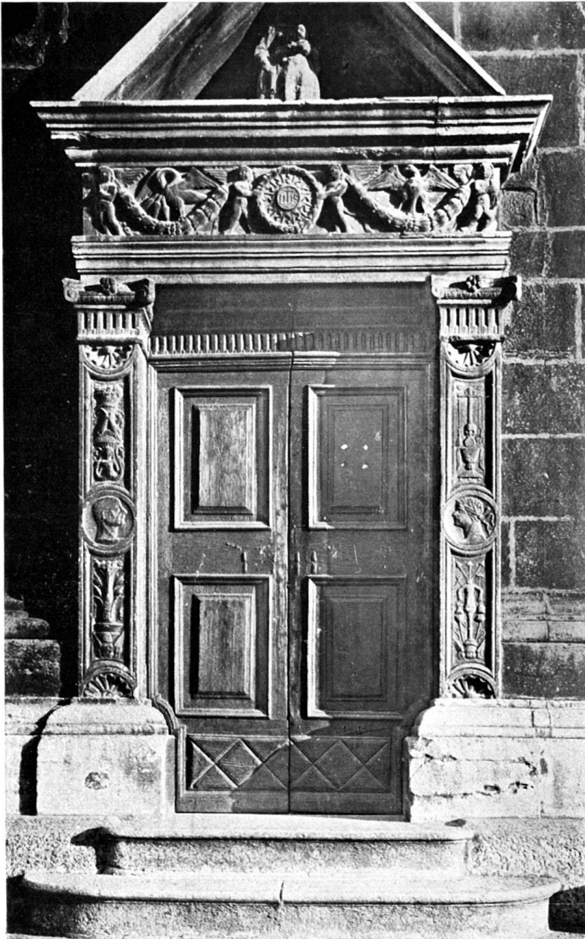
PORTA LATERALE SINISTRA.