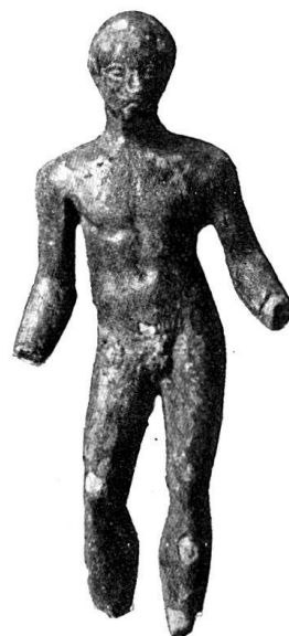
n o 16.