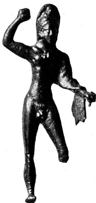
n o 2.