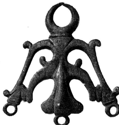
n o 24

montre ce bronze avec une série d'amulettes, encore en usage à Naples, mais dont le type remonte à l'antiquité; elles représentent la branche de rue, plante dont le pouvoir magique est connu 1) , à laquelle sont attachés divers autres objets ayant même puissance, entre autres, comme ici, le croissant lunaire 2) . Il est vraisemblable de penser que l'amulette de Neuchâtel appartient à cette curieuse série.