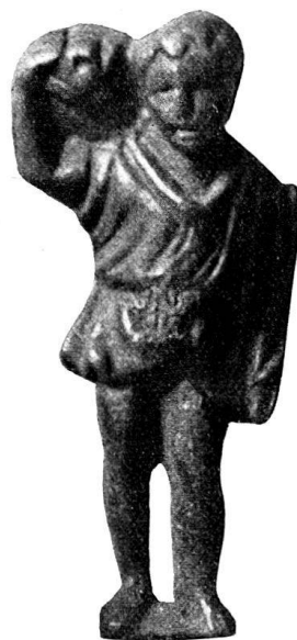
n o 17.