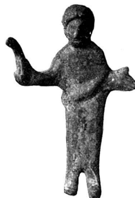
n o 15.