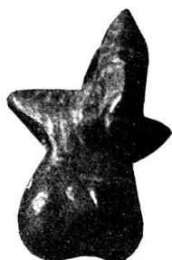
n o 23.