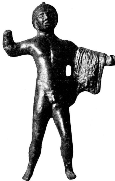
n o 1.

Grâce à la complaisance de M. P. Vouga, conservateur de la section archéologique, que je tiens à remercier, j'ai pu photographier les quelques figurines de bronze que possède le Musée, et j'en donne ici la reproduction. La brièveté du com-