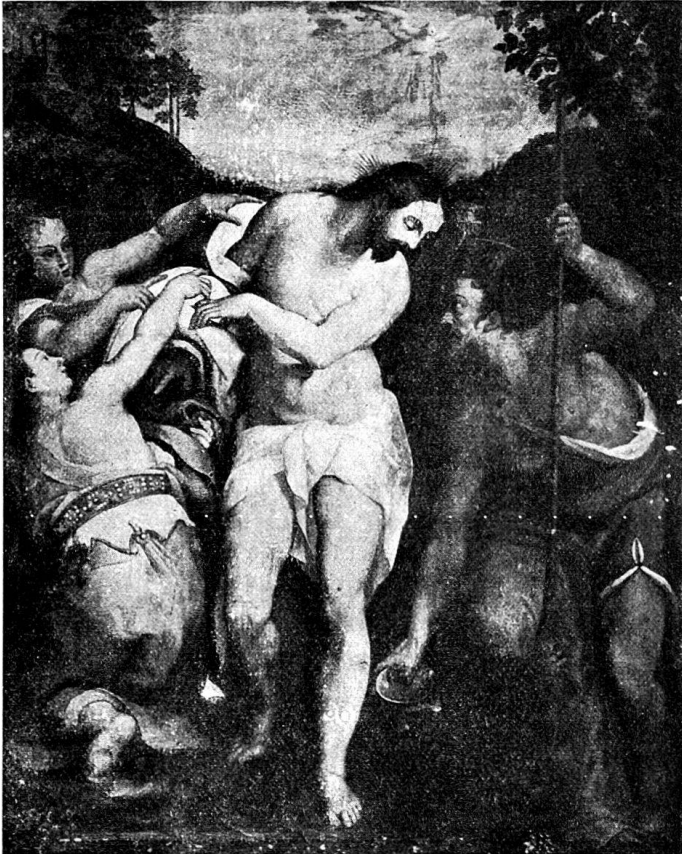
Abb. 2. Taufe Christi. Altarbild in Privatbesitz. Von Dionys Calvaert?

In disem nachgeschribnen Buch stadt geschriben der Ursprung und Anfang der löblichen Capel zu Unser Frouwen Mittylden in dem Getschwylter , geschriben worden in dem Jar des Herren 1578 den andern Tag Octobris von mir Briester Martinus Bosch , zur selbigen Zytt Kilchherr zu Spiringen. 2)