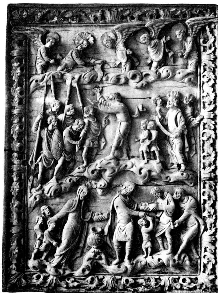
ELFENBEINRELIEF IN PRIVATBESITZ.