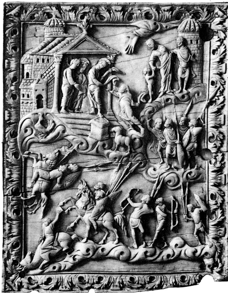
ELFENBEINRELIEF IM SCHWEIZ. LANDESMUSEUM.