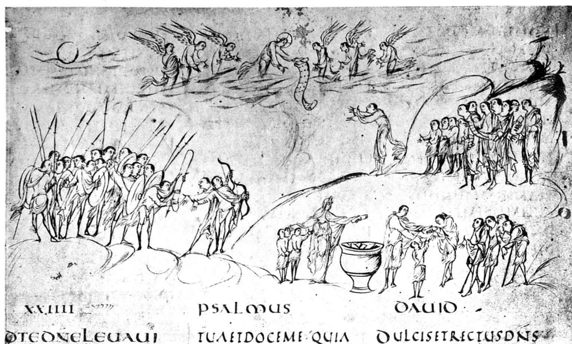
PSALM 24 DES UTRECHT-PSALTERS.