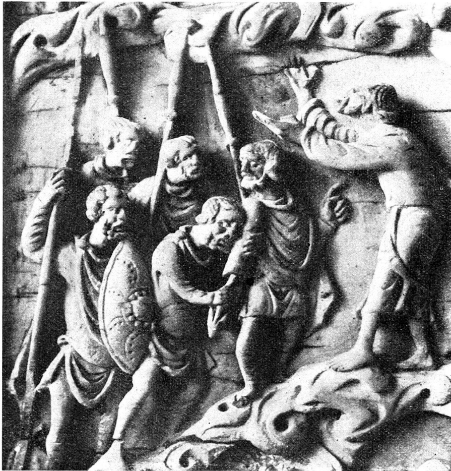
Abb. 1. Detail aus der Elfenbeintafel in Privatbesitz, vergrößert.

Die Ausführung ist die subtilste. Besonders gilt das von der ersten Tafel, wo die etwas größeren Verhältnisse der Figuren eine noch eingehendere Behandlung der Köpfe und der vorzüglich gezeichneten Hände erlaubte, als sie das ohnehin etwas abgeschliffene Relief der zweiten (Rheinauer) zeigt.