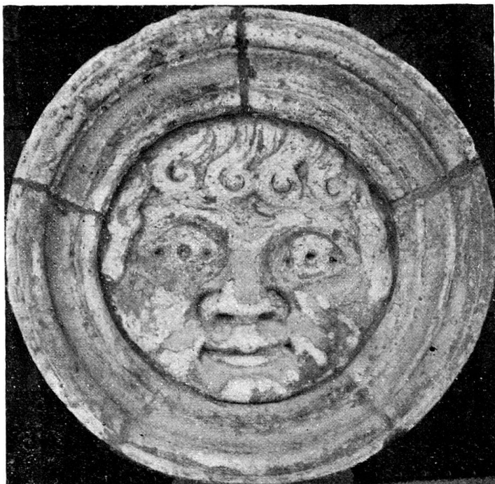
106. Médaillon encastré dans la façade orientale d'une chapelle de croisillon sud du transept de Saint-Pierre à Genève.

comme on l'a prétendu, le dieu tutélaire, le patron de Genève, bien que l'inscription : Deo invicto Genio loci , semble à première vue le faire croire. Le deus est absolument différent du genius , divinité inférieure. L'inscription est une double dédicace. 1) Elle ne prouve qu'une chose, c'est que Mithra était adoré à Genève au troisième siècle. Il n'y a pas lieu d'en tirer aucune conclusion sur l'existence du temple d'Apollon.