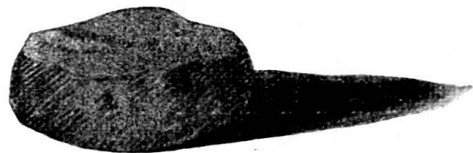
Fig. 86. Calculus trouvé à Avenches.

en bronze , forme de coupe, lignes circulaires, hauteur 40 m/m., diamètre 95 m/m. 14° une mosaïque que le Conservateur sortira, dès que le temps sera favorable. Il a l'intention de la placer sous le hangar du Musée, si possible, dans la position qu'elle occupe sur le terrain, pour donner au public une idée plus exacte de ces remarquables monuments de l'art antique. Il est regrettable qu'il ne soit pas possible de laisser les mosaïques sur le terrain même où elles sont découvertes. 15° une jolie clochette en bronze quadrangulaire , sans battant, avec anneau de suspension et, ce qui intéressera surtout les archéologues, 16° un fragment d'inscription , largeur de ce fragment 28 cm. hauteur 19 cm. épaisseur du marbre 38 mm.; à la première ligne, le bas d'un V et les lettres LIVS et le bas d'un A, les lettres de cette ligne ont 68 mm.; à la seconde ligne . . . LLAME et le fragment d'un T, les lettres de cette ligne ont 58 mm.; en dessous se trouve la partie supérieure d'un F et peut-être d'un T. Ce fragment d'inscription a été