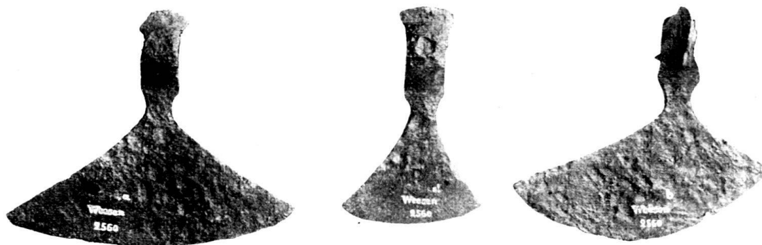
Fig. 73. Eisenäxte aus Weesen Schweiz. Landesmuseum

Weesen. Das Schweiz. Landesmuseum bewahrt aus Weesen 4 Eisenäxte auf, die in La Tène-Funden, südlich der Alpen, besonders im südwestlichen Oesterreich nicht selten sind, bei uns aber sonst fehlen (Fig. 73).