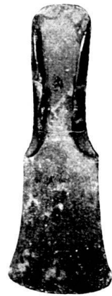
Fig. 71. Bronzebeil aus Walenstadt.