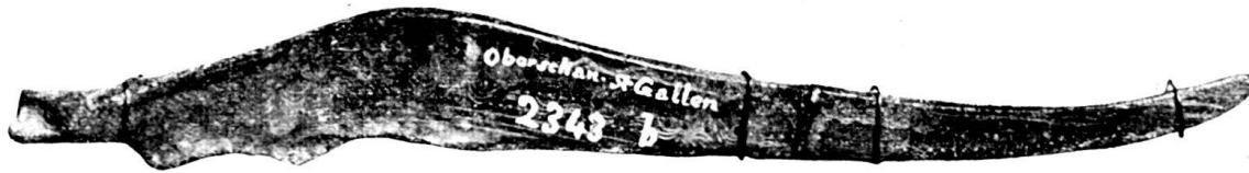
Fig. 72. Bronzemesser aus Oberschan, Kt. St. Gallen. Schweiz. Landesmuseum.

Auf einem Vorberge der Alp Palfries fand man eine Bronzenadel laut Anzeiger für schweiz. Altertumskunde I (1871), p. 236.