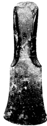
Fig. 71. Bronzebeil aus Walenstadt.