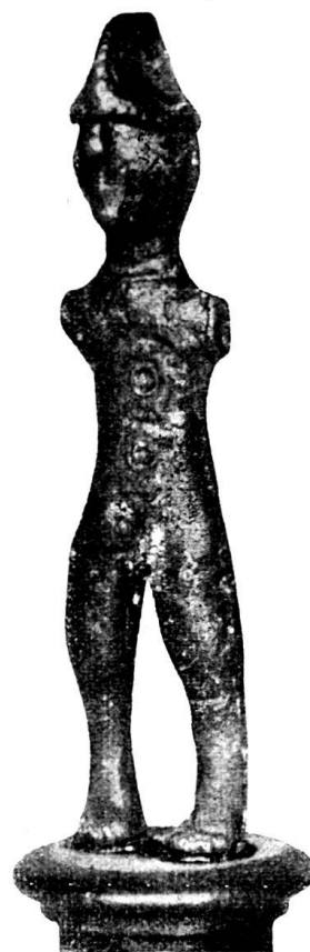
Fig. 69. Statuette aus Vild bei Sargans (siehe Seite 116).

Vilters wird 998 zum ersten Male urkundlich genannt, dann 1288, als die Bewohner des Dorfes dem Kloster Pfävers den Zehnten zahlen mußten.