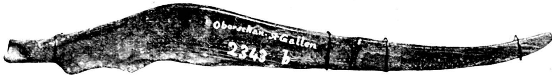
Fig. 72. Bronzemesser aus Oberschan, Kt. St. Gallen. Schweiz. Landesmuseum.

Auf einem Vorberge der Alp Palfries fand man eine Bronzenadel laut Anzeiger für schweiz. Altertumskunde I (1871), p. 236.