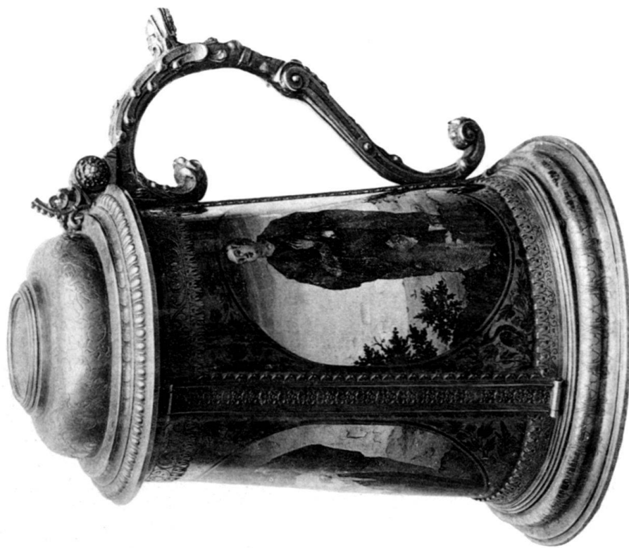
Nr. 1 (in Nürnberg).