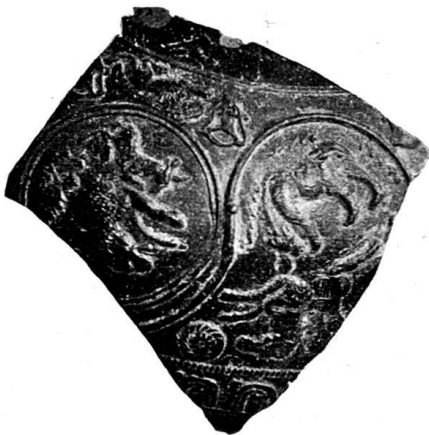
Fig. 51. Röm. Terra-sigillata-Scherbe mit Barbotine.