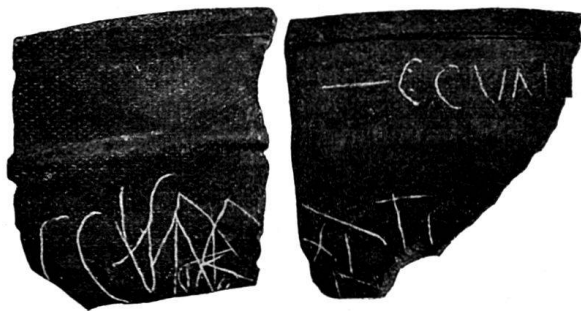
Fig. 52. Schwarze Tonscherben mit eingekritzter Inschrift.

Auffallend groß endlich ist die Zahl der flüchtig eingekritzten Buchstaben der auf Karton XIV aufgehefteten Gefäßfragmente aus schwarz gebranntem Ton. 1)