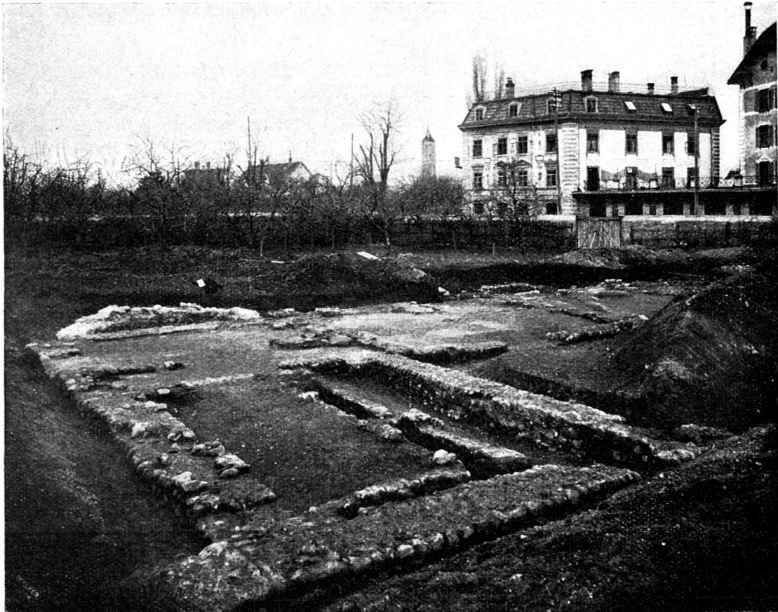
Fig. 49. Ausgrabungen in der Custorei in Chur.

Auch westlich vom abgedeckten Gebäude ergaben Sondierlöcher Mauerreste, doch wird man diesen — der benachbarten Fruchtbäume wegen — nicht nachgehen können.