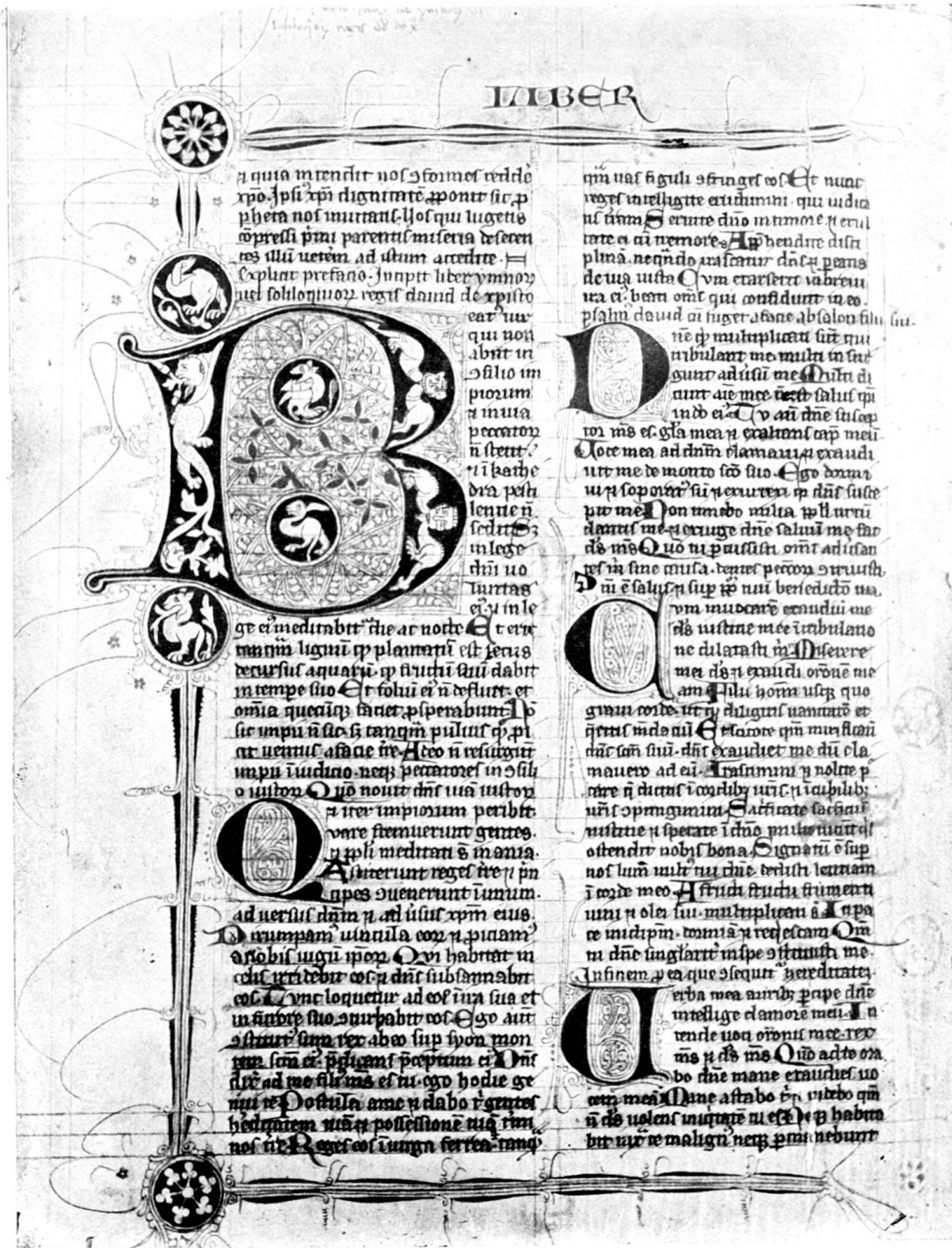
Probe aus Cod. 6. (Höhe des Originals 368 mm.)