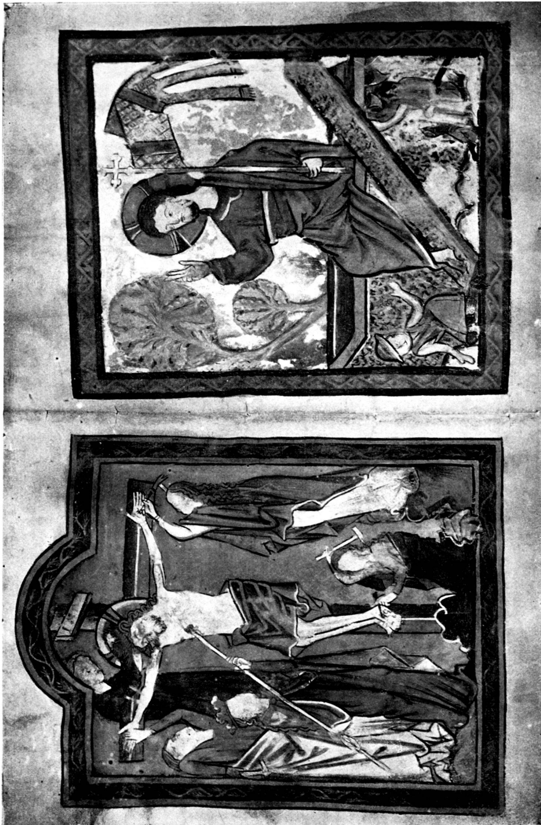
Aus Cod. 61, Seite 5 b und 6 a .