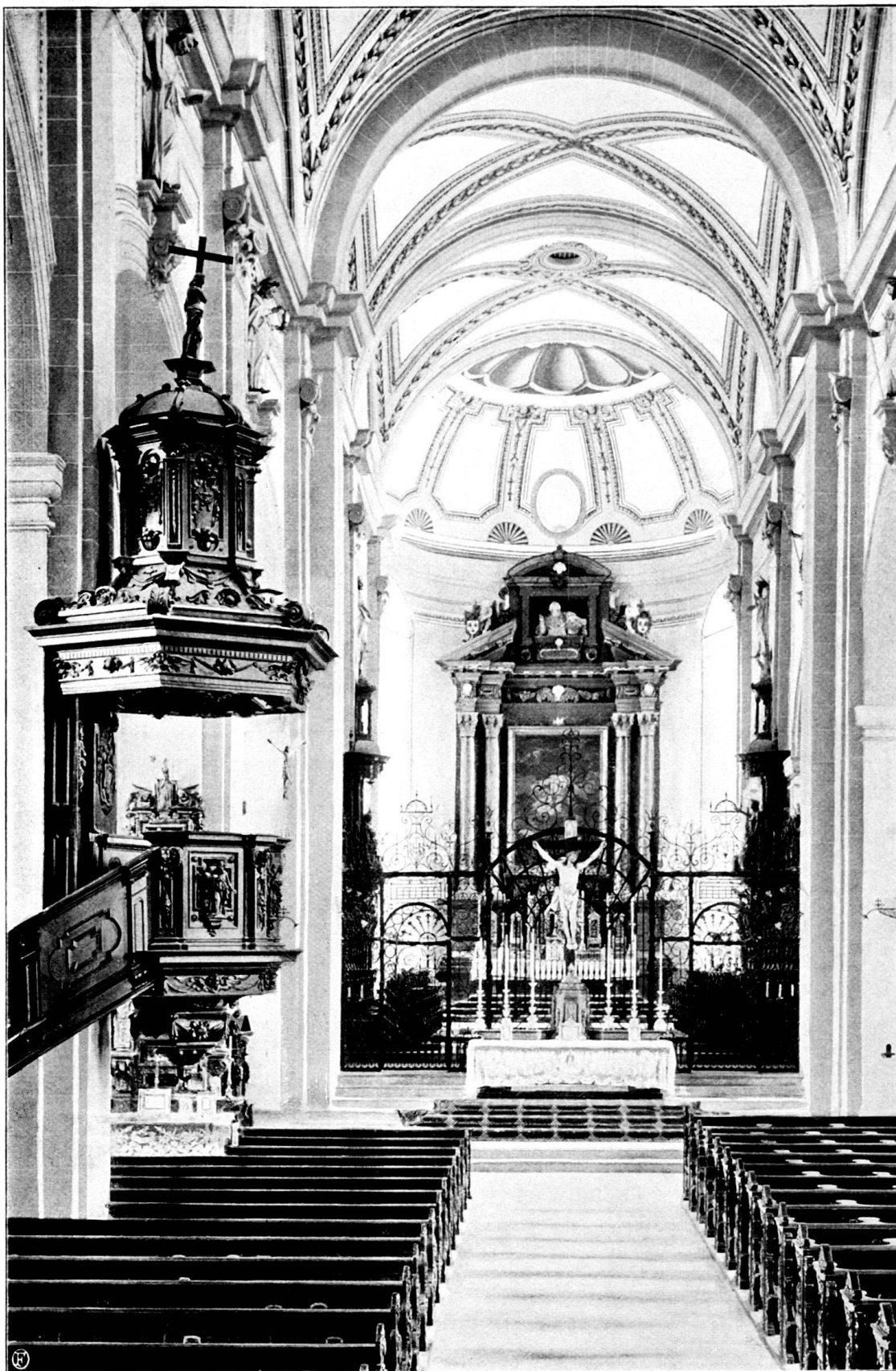
Kanzel in der Hofkirche zu Luzern mit Ausblick in den Chor.