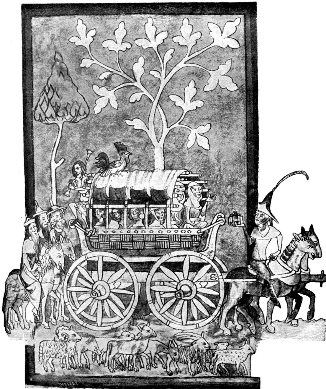
AUSZUG JAKOBS UND SEINER SÖHNE NACH ÄGYPTEN. AUS DER WELTCHRONIK DES RUDOLF VON EMS IN ZÜRICH.