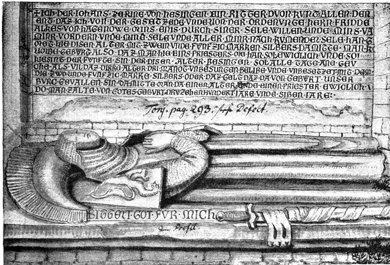
GRABMAL DES JOHANN ZU RHEIN VON HÄSINGEN IN DER EHEM. JOHANNITERKIRCHE ZU BASEL.