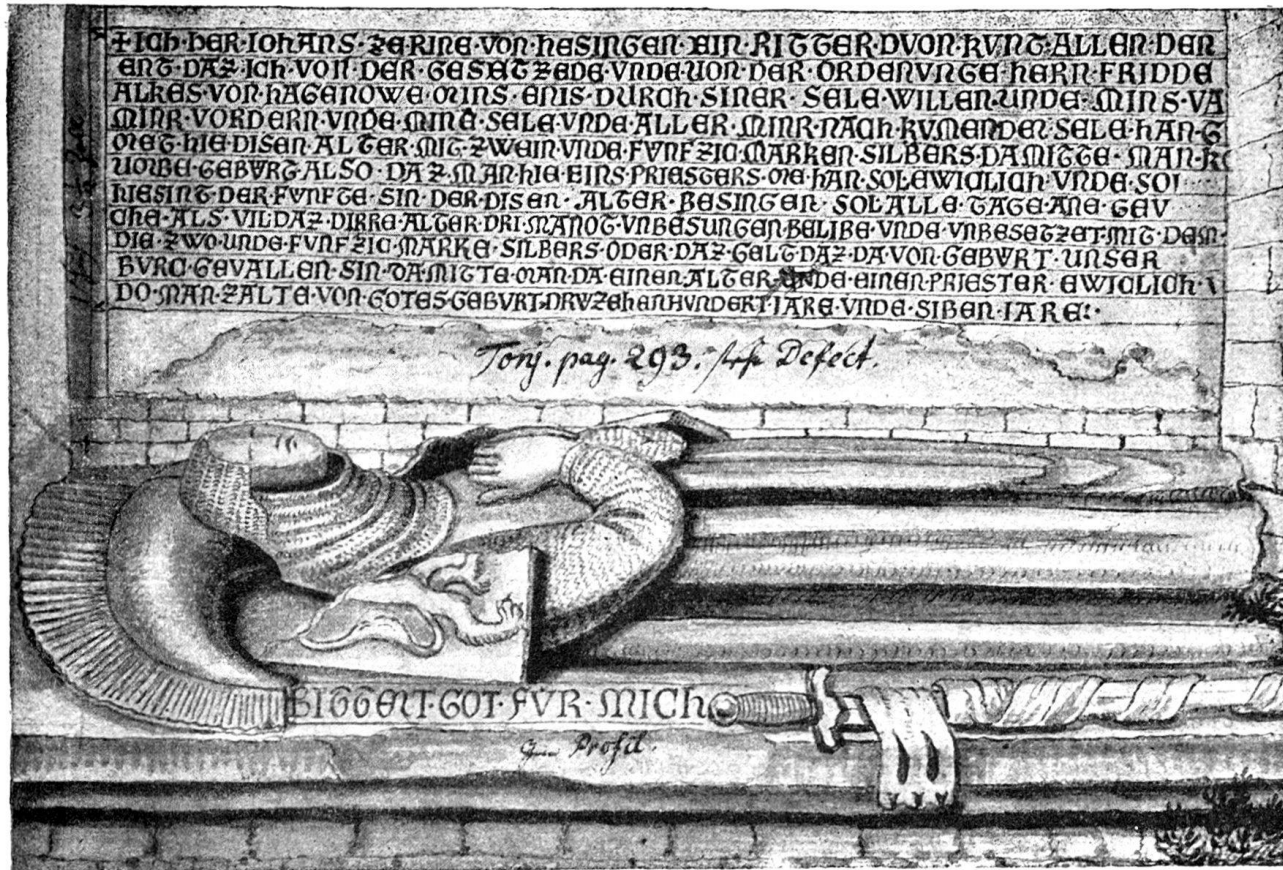
GRABMAL DES JOHANN ZU RHEIN VON HÄSINGEN IN DER EHEM. JOHANNITERKIRCHE ZU BASEL.