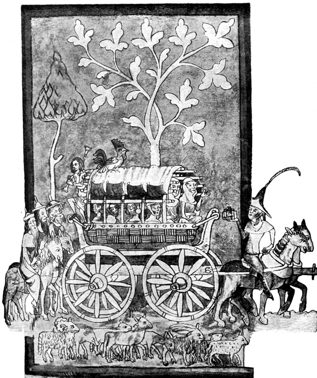
AUSZUG JAKOBS UND SEINER SÖHNE NACH ÄGYPTEN. AUS DER WELTCHRONIK DES RUDOLF VON EMS IN ZÜRICH.