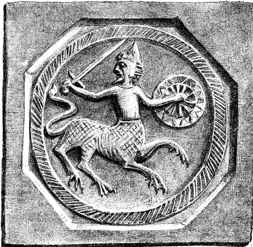
m 0, 15 3 / 4