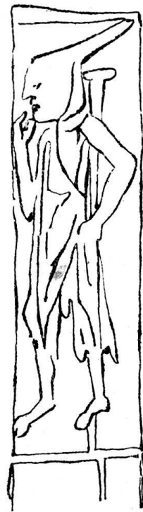
m 0, 16 3 / 4