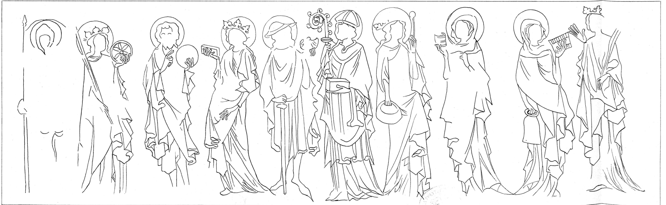
Anzeiger f. Schweiz. Alterthskde. 1884 N° 2