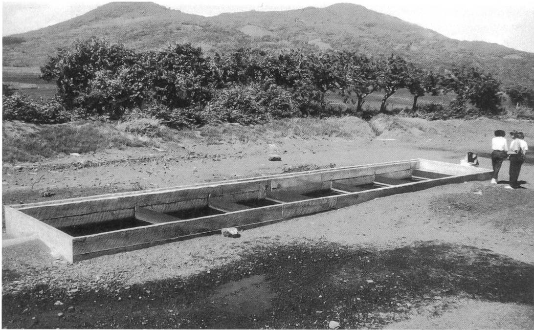
Das Filter besteht aus mehreren Kammern, von denen jede die durchschnittliche Tagesmenge an Pestizidabwässern aufnehmen kann.

Eine der Möglichkeiten, die Effektivität des Abbaus zu überprüfen, wäre der gaschromatographische Nachweis der im Filtrat verbleibenden Pestizide, also eine quantitative Erfassung der Abbaupkapazität. Neben methodischen Problemen, die sich mit solch einer Bestimmungsmethode stellen, stellt sich in Nicaragua auch das Problem der fehlenden Ausstattung. In ganz Nicaragua gibt es nur zwei oder drei funktionierende Gaschromatographen.