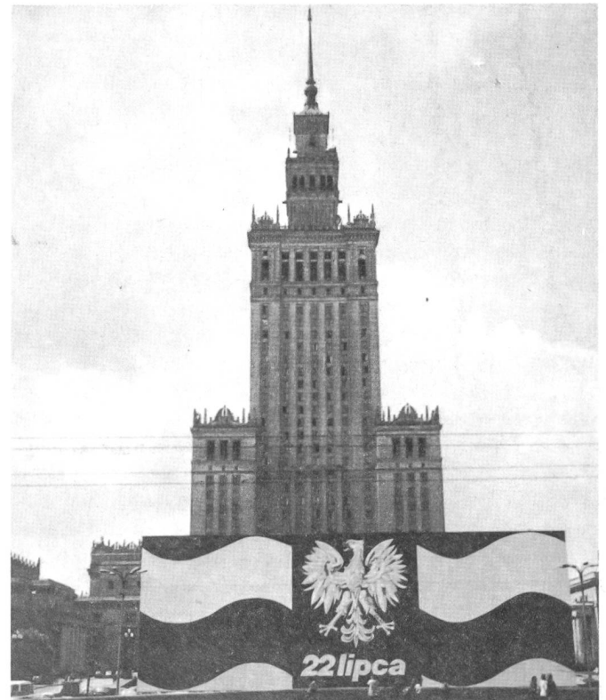
Freie Wahlen auf allen Ebenen: Sitz der polnischen Akademie der Wissenschaften im Warschauer Kulturpalast

Zieht man vor dem Hintergrund der kooperationsintensiven siebziger Jahre eine Zwischenbilanz der ersten Hälfte der achtziger Jahre, so waren diese für alle Beteiligten unter dem Aspekt der wissenschaftlich-technischen Zusammenarbeit nicht besonders ergiebig. Das Durchführungstempo gemeinsamer Projekte hatte wieder nachgelassen, ebenso der Austausch von Lizenzen und Personal. In der wissenschaftlich-technischen Zusammenarbeit mit RGW-Partnern und in der Praxis des Technologietransfers hatte sich Polen von 1970 bis zu Beginn der 80er Jahre, d.h. bis zum