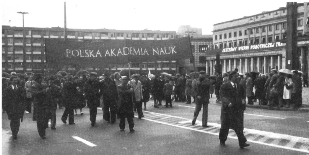
Als Organ der staatlichen Verwaltung in Frage gestellt: die polnische Akademie auf dem 1. Mai