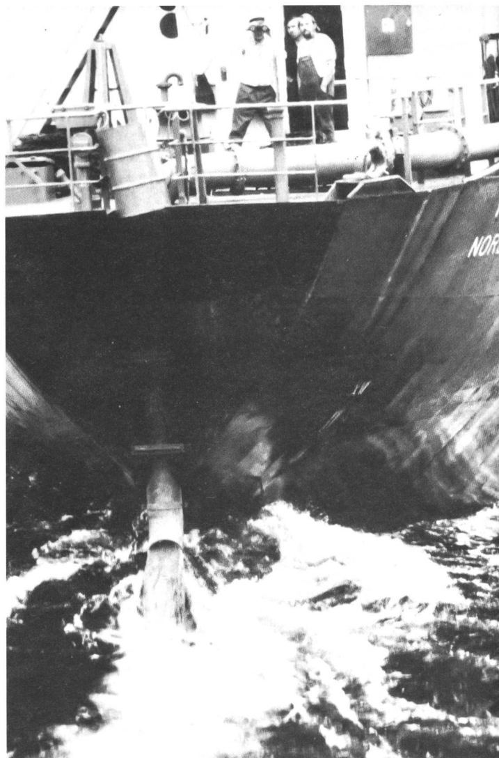
Verklappung von Titanoxid in die Nordsee

Schwermetalle hätten in der Umweltbelastung keine Bedeutung mehr, würden wir das Maß ihrer Schädlichkeit an ihrem Echo in der Presse messen. Lange haben neue »Moderegifte« wie Dioxine, PCBs und Tschernobylisotope ihnen den Rang in den Spitzenmeldungen über Umweltgifte abgelaufen. Am Ende der 70er Jahre gehörten sie noch zu den am meisten genannten Umweltbelastungen, heute sind sie fast in Vergessenheit geraten. Und das zum Teil leider zu Unrecht, denn sie werden weiter in großen Mengen produziert, sie sind weiter in großen Mengen in unserer Umwelt vorhanden, sie werden weiter in die Biosphäre emittiert, und auch ihre Eigenschaften, sich anzureichern und zu akuten und schleichenen Vergiftungen zu führen, haben sie nicht verloren. Ihre Rolle für den Ökokreislauf und ihr Anteil am Gefahrenpotential für die Umwelt muß im Spannungsfeld zwischen steigender Produktion