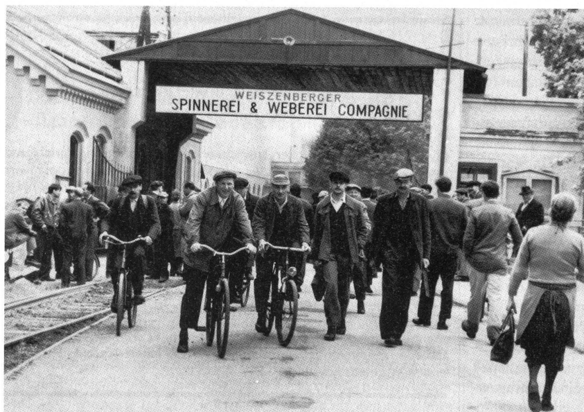
Arbeiter in Marienthal

Szenenfoto aus einem Fernsehfilm von Karin Brandauer