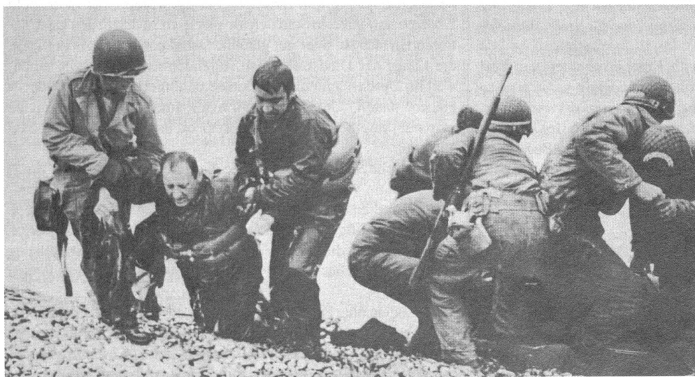
Sich Gedanken machen, was in den Köpfen der Soldaten vorgeht.

Die Idee der Sekundäranalyse fand zwar sicherlich ihren Durchbruch mit deren Anwendung im »American Soldier«, doch die Entstehung reichte einige Jahre zurück. Die Rockefeller-Stiftung hatte einen großen Auftrag über die Auswirkungen des Rundfunkhörens auf die amerikanische Gesellschaft vergeben, der im Office of Radio Research in Princeton abgewickelt wurde, und es fehlten die Mittel, um im erheblichen Umfang Primärmaterial zu beschaffen. Aus dieser Zwangslage heraus besorgten sich die Forscher Umfragen von Gallup, in denen vergleichende Fragen über Zeitungslektüre und Rundfunkhören gestellt worden waren, und unterwarfen sie neuerlichen Analysen, beispielsweise um den Einfluß sozialer Unterschiede herauszuarbeiten. Wenig später wurde im Rahmen des-