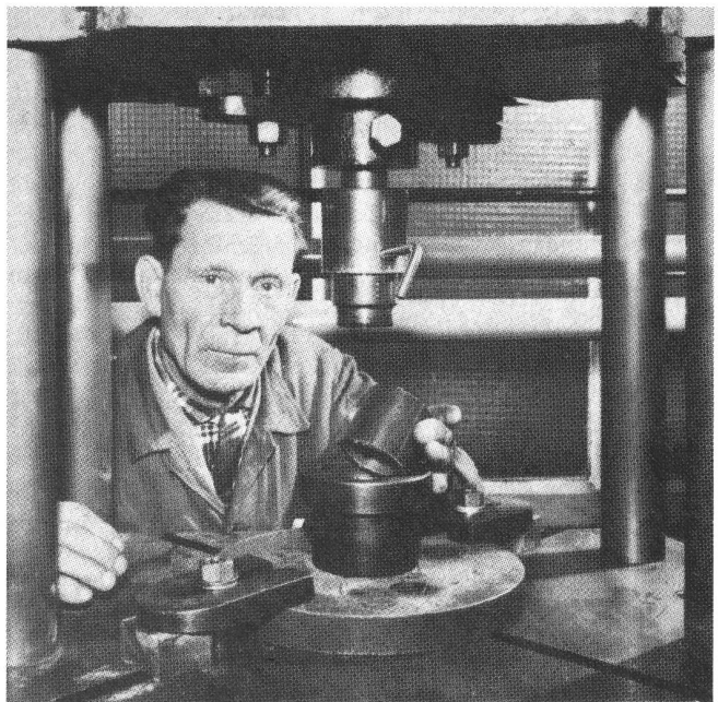
Requalifizierung nur für einen kleinen Teil

Mit dem massiven Einsatz von Betriebsdatenerfassungs- und Personalinformationssystemen wird der Spielraum einzelner