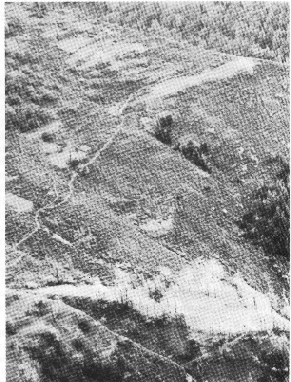
Diese Aufnahme aus dem Monat Mai zeigt sehr deutlich den Unterschied zwischen bearbeiteter (= helle Stellen) und unbearbeiteter Natur (= dunklere Stellen): Auf den bearbeiteten Stellen, wo das Gras kurz ist, kann sich das neue Wachstum sofort nach der Schneeschmelze entfalten; auf den unbearbeiteten Stellen dagegen bildet das lange Gras vom alten Jahr einen Grasfilz, der das Wachstum noch für einige Zeit behindert – der Mensch kann mit seiner Arbeit das Wirken der Natur in eine bestimmte Richtung vorantreiben.

Die verschiedenen Grade der Produktivität der Arbeit können sich im Rahmen der heutigen Wirtschaftssysteme nicht ergänzend und komplementär zueinander verhalten, sondern sind allein über die Konkurrenz miteinander vermittelt: Nur dort, wo es am billigsten ist, wird z.B. noch Getreide angebaut, an allen anderen Stellen wird es ökonomisch unsinnig. Durch die jüngsten Entwicklungen der Landwirtschaft (die nur zum kleinen Teil durch einen wirklichen Fortschritt in der Kenntnis der natürlichen Zusammenhänge erreicht wurden, zum großen Teil bloß durch kurzfristigen Raubbau an der Kulturlandschaft erwirkt wurden) ist die moderne, industriell betriebene Landwirtschaft so produktiv geworden, daß sie auf einer verhältnismäßig kleinen Fläche Berge von Lebensmitteln produzieren kann, die ganz Europa ernähren können. Wenn man auf den restlichen, großen Gebieten noch Landwirtschaft betreibt, so widerspricht das vollständig der heutigen ökonomischen Lage. Damit wird aber die landwirtschaftliche Arbeit völlig verkannt: Die Landwirtschaft ist gerade diejenige Tätigkeit des Menschen, die den Naturraum für den Menschen überhaupt erst herrich-