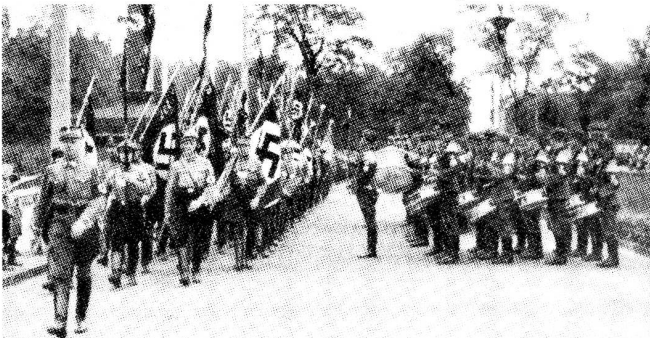
„Die Fahnen maschieren zur Feierstunde ein“ (Ingenieurtage in Darmstadt, Juni 1936)

Andererseits wird man Hortleders Urteil zustimmen müssen, daß die Haltung des größten deutschen Ingenieurvereins gegenüber dem nationalsozialistischen Machtanspruch im Jahre 1933 „durch eine Mischung aus naiver Hilfslosigkeit, bedingungslosem Opportunismus im großen und partiellen Widerstand im Detail“ gekennzeichnet war. Entscheidend für die Ingenieure dürfte in diesem Zusammenhang der „bedingungslose Opportunismus“ gewesen sein, der in der ausgegebenen Losung „Ich dien“ 1 so besonders deutlich zum Ausdruck kam. Die „naive Hilfslosigkeit“ erfaßte demgegenüber auch andere, sogar primär politisch geschulte Gruppen, so daß es ungerecht wäre, technischer Intelligenz besondere Vorwürfe zu machen. Deren unpolitisches Selbstverständnis beschwört freilich immer wieder die Gefahr herauf, daß sie zum Spielball für andere