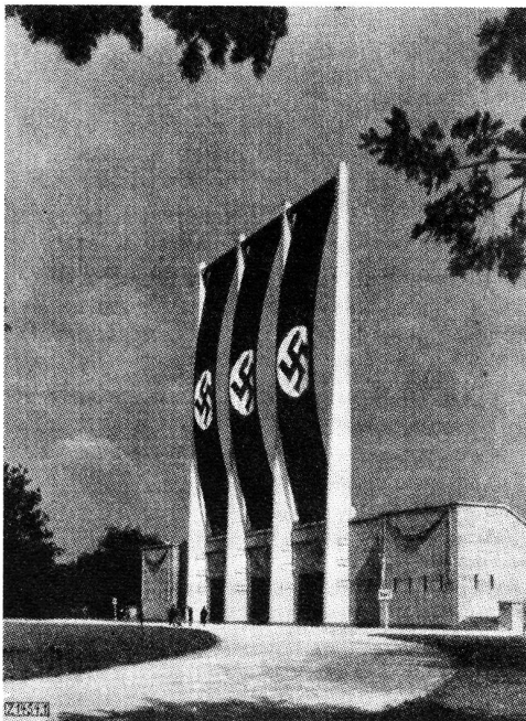
Abb. 2. Die Masten mit gehißten Fahnen. Von hinten gesehen.

Die vier Masten dienen zur Aufnahme von drei großen, das ganze Aufmarschfeld beherrschenden Hakenkreuzfahnen s. Abb. 2. Es sind glatte Stahlsäulen von 33 m Höhe über dem Boden mit rechteckigem Querschnitt, der sich von unten nach oben von etwa 2000 mm \times 400 mm auf 650 mm \times 400 mm verringert.