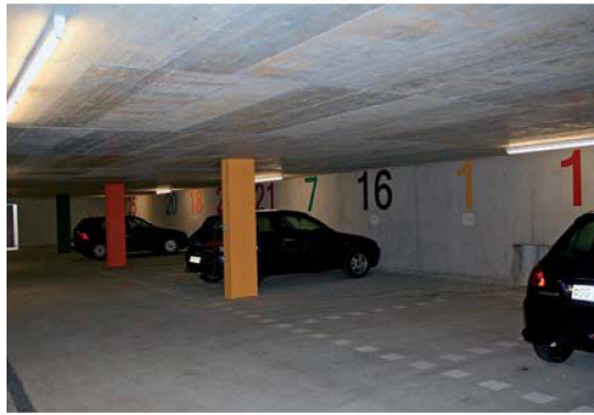
Spielerei bei der Nummerierung der Parkfelder in der Einstellhalle.