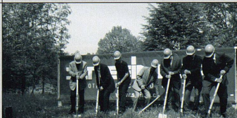
Baubeginn in Zürich-Witikon. 75 Wohnungen erstellen die Baugenossenschaften Asig und WSGZ gemeinsam.