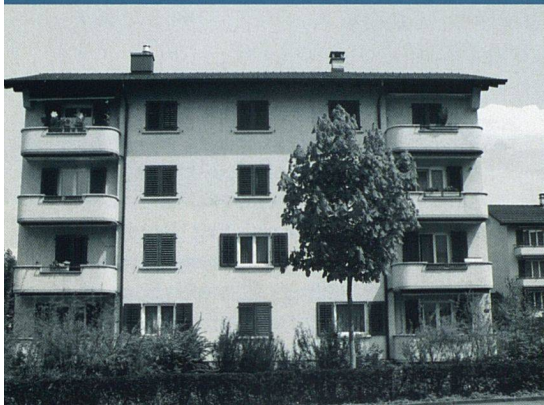
1953 zogen die ersten MieterInnen der Baugenossenschaft Matt in die Liegenschaft an der Luzernerstrasse 148 in Littau LU ein.