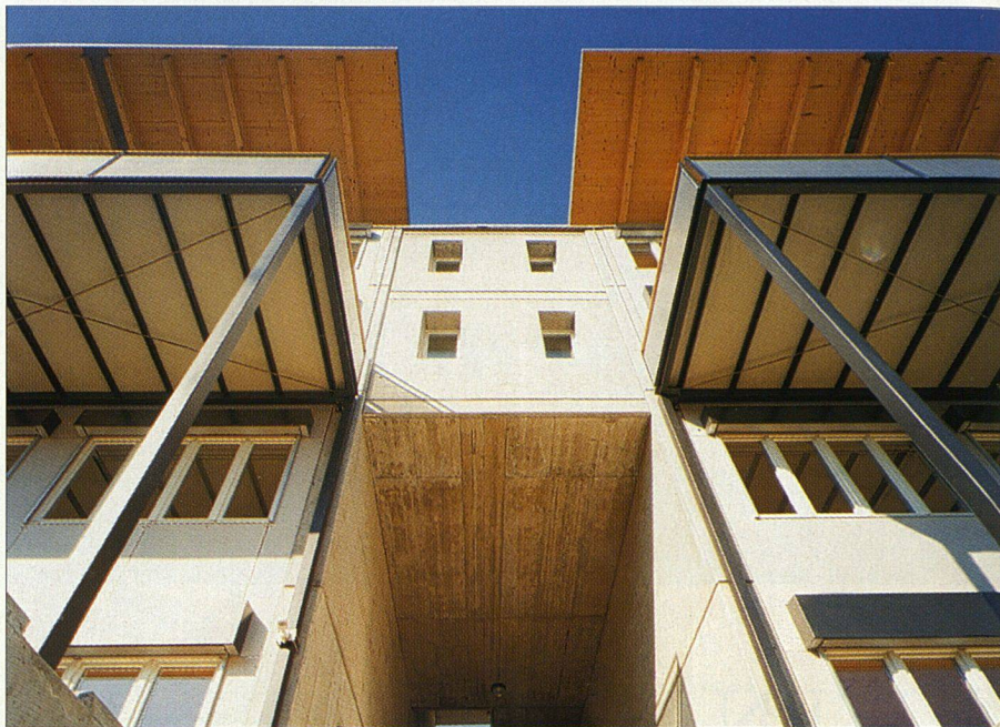
Die vertikalen Treppenhäuser aus Beton dienen im Brandfall als Fluchtweg.

Der «Aktionsplan Holz 2000», welcher von der Schweizerischen Holzwirtschaftskonferenz erarbeitet wurde, hat deshalb zum Ziel, die Holz-Ressourcen des Schweizer Waldes besser zu nutzen. Das bedeute in erster Linie, umfassend zu informieren. Noch immer leide Holz unter Vorurteilen, zum Beispiel im Bereich Schall- und Brandschutz. Aufgrund solcher Vorurteile sowie mangelnder Kenntnisse der Entscheidungsträger erhält Holz bei Bauvorhaben oft keine Startmöglichkeiten. Die kleinstrukturierte und dezentrale Holzbranche erschwert das Auslösen und die Finanzierung der frühzeitigen Erarbeitung von Holzvarianten. Hier soll «Holz 2000» in Aktion treten und Starthilfe leisten, genauso wie es Projekte mit Signalwirkung unterstützen will: Projekte, die das Vertrauen der Kunden gegenüber dem Werkstoff Holz fördern, auf dem Markt bestehen können oder sich publikumswirksam «verkaufen» lassen.