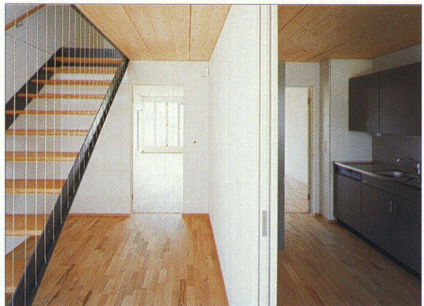
Parkettböden, elegante Treppe – auch der Innenausbau der Wohnungen kann sich sehen lassen.

Eine Aufgabe, die es noch zu erfüllen gelte, sei, die Mieter/innen über richtiges Lüften zu informieren. «Bei einem k-Wert von 0,2, wie das bei der Überbauung der Fall ist, müsste man täglich vier bis fünf Mal während fünf bis zehn