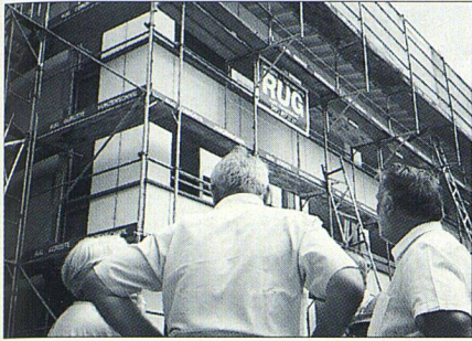
Der grosse Umbau in Windisch interessierte...