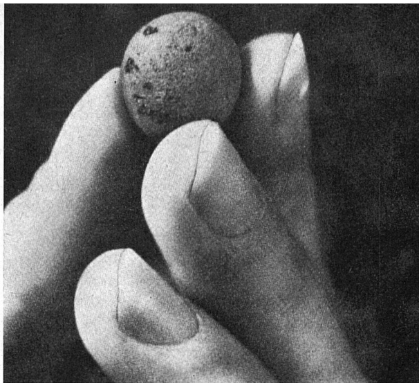
Einzelnes Leca Korn

Im Einlaufteil des Ofens wird zunächst der Ton getrocknet, während im Auslaufteil des Ofens der Ton gebläht und gebrannt wird. Die beim Brennprozeß entstehenden Abgase durchstreifen den Einlaufteil des Ofens und trocknen dort auf wirtschaftliche Weise den Ton. Eine weitere wichtige Funktion des Einlaufteiles besteht in der Verformung des Tones zu Granalien. Im Auslaufteil des Ofens erfolgt das eigentliche Brennen der Leca Körner. Die getrockneten Tongranalien werden bis auf eine Temperatur erhitzt, in welcher