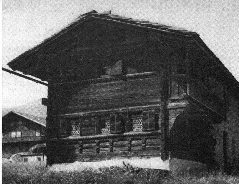
Das Heimatmuseum «Nutti-Hüüli» in Klosters GR, ein wertvoller Zeuge (Holzbau) alter Bauernkultur. Das Schloß an der Eingangstüre ist vollständig aus Holz hergestellt und kann nur von Eingeweihten geöffnet und geschlossen werden. (Ida Berner)

Wenn wir im Urkundenbuch der Natur lesen, so stellen wir fest, daß der Wald als solcher große Wandlungen durchgemacht hat. Der Wald, in seiner Lebensform eine Gemeinschaft, blieb Urwald, indem nur die Naturgesetze frei schalteten und walteten, so lange, bis der Mensch Ackerbauer und Viehzüchter wurde und anfang, sich mit dem Wald auseinanderzusetzen, ihn rodet und ihm damit den Boden abrang, den er für seine Landwirtschaft benötigte. Nun war es nicht mehr die Natur allein, die die Lebensgemeinschaft Wald regierte. Diese wandelte sich von nun an immer mehr nach dem Willen des Menschen und seinen Bedürfnissen. Um das Ende des 12. bis gegen Mitte des 13. Jahrhunderts flaute die Waldrodung im schweizerischen Mittelland allmählich ab und war wohl im Großen auch im Gebirge mit dem 14. Jahrhundert abgeschlossen. Bis zu diesem Zeitpunkt war der Wald noch kein Wirtschaftsgut. Holz war noch keine Handelsware im heutigen Begriffe und diente nur dem Eigenbedarf von Haus und Hof und für den Herd. Ein eigentlicher Holzhandel begann sich erst mit der zunehmenden Bevölkerung in den