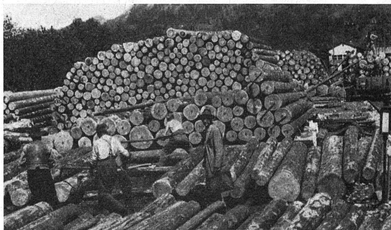
Holzlagerplatz beim Bahnhof Klosters. Fichtenstämme für den Eisenbahnverlad, ein wertvolles Transportgut. (Ida Berner)

Die Forschung ist bekanntlich die Grundlage jeder Lehrtätigkeit; so wurde im Jahre 1855 die Eidgenössische Zentralanstalt für forstliches Versuchswesen geschaffen, mit einem Lehrstuhl für Waldbau an der ETH in Zürich. Dadurch wurden Forstfachleute ausgebildet und erstmals ein naturnaher schweizerischer Waldbau begründet. Ein von berufenen Forstfachleuten wohlgepflegter, richtig bewirtschafteter Wald ist eine Quelle der Freude und des Wohlstandes. Dem Förster liegt der ihm anvertraute Wald am Herzen, er hegt und pflegt ihn mit Liebe und Sorgfalt, schafft dem heranwachsenden Baum Raum für freie Entfaltung und kümmert sich um sein Wohl und Gedeihen. Im Waldbau wird die Naturverjüngung vorgezogen, Pflanzungen sollen, abgesehen von Neuaufforstungen, nur Hilfsmittel zur Ergänzung unvollkommener natürlicher Jungwachsgruppen sein.