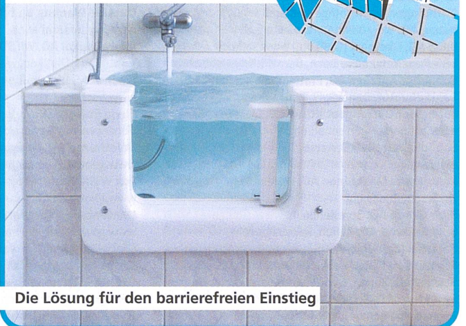
Die Lösung für den barrierefreien Einstieg