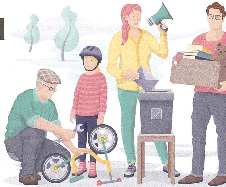
Menschen engagieren sich in allen Lebensbereichen freiwillig. Online-Plattformen vereinfachen heute die Vernetzung Gleichgesinnter.

Seit ihrer Gründung vor 175 Jahren basiert die moderne Schweiz auf einem Gesellschaftsvertrag, der auf Selbstbestimmung und Eigenverantwortung setzt und auf freiwilligem Engagement der Bevölkerung beruht. Die Menschen setzen sich für die Gemeinschaft ein, übernehmen Verantwortung für andere und leisten damit einen Mehrwert für die Gesellschaft. Sie tun dies zum Beispiel als Ehrenamtliche im Theaterverein, als Freiwillige für das Rote Kreuz, als Trainerin des Fussballnachwuchses, als Kommunalpolitikerin, als aufmerksamer Nachbar, als Genossenschafterin in der Siedlung, als Freiwillige bei der Feuerwehr oder als Redakteur:innen bei Wikipedia.