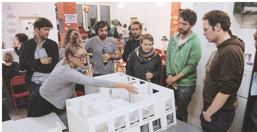
In zahlreichen Workshops wurde gemeinsam entwickelt, wie man sich organisiert und zusammenlebt. Dabei entstand auch die Idee des geteilten WLAN-Netzes.

Die aktuelle Durchflussrate beträgt ein Gigabit pro Sekunde. «Das ist nicht mal wahnsinnig schnell, reicht gemäss unseren statistischen Auswertungen bis jetzt aber aus. Die Kapazität ist nicht ausgeschöpft, nicht einmal mit streamenden