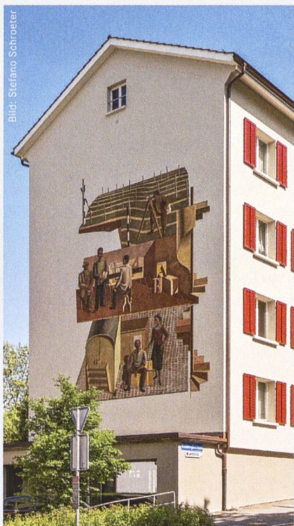
Not einer Familie im Weinbergli in Luzern.

sehen. Erni wurde angewiesen, die «Idee des genossenschaftlichen und sozialen Wohnungsbaus» aufzuzeigen und den Baugrund ins Bild zu integrieren. Das Wandbild wurde in matten Braun- und Graustufungen gemalt und verbindet drei Sujets symbolisch durch eine Wendeltreppe. Das unterste Bild zeigt eine Familie neben einem Möbelwagen, die mit ihrem gesamten Hausrat auf die Strasse gestellt wurde. Der mittlere Teil des Freskos zeigt, wie diesem Notstand Abhilfe geschaffen werden kann: Vertreter der Genossenschaft besprechen das Bauvorhaben mit einem Architekten, der Präsident trägt die Uniform eines Eisenbahners. Das oberste Bild zeigt den Beginn der Bauarbeiten: Ein Techniker ist mit Vermessungsarbeiten beschäftigt. 1980 wurde das Fassadenbild durch einen Restaurator in Zusammenarbeit mit dem Künstler restauriert.