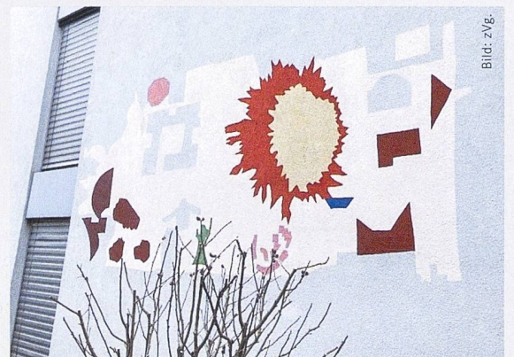
Figuren und Blumen in der Zelgmatte in Lenzburg.