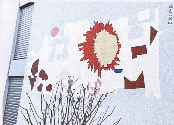
Figuren und Blumen in der Zelgmatte in Lenzburg.