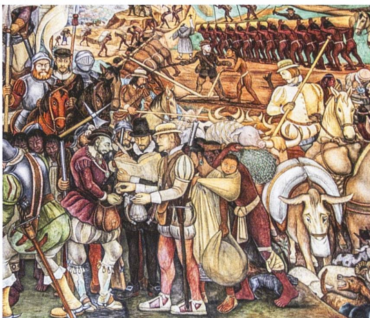
Zu den bekanntesten Werken des Muralismo zählen Diego Riveras Malereien im Palacio Nacional in Mexiko Stadt.

viele Wandbilder anfertigen wie keine andere in Zürich. Vor fünf Jahren hat die ABZ ein Kunstinventar erstellen lassen, das vierzig Kunstwerke in ihren Siedlungen dokumentiert, und ein Buch zum Thema herausgegeben.