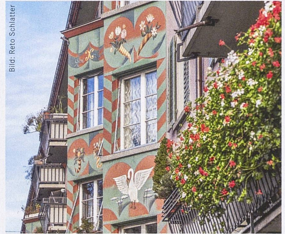
Leben in der Natur an der Siedlung Sihlfeld in Zürich.