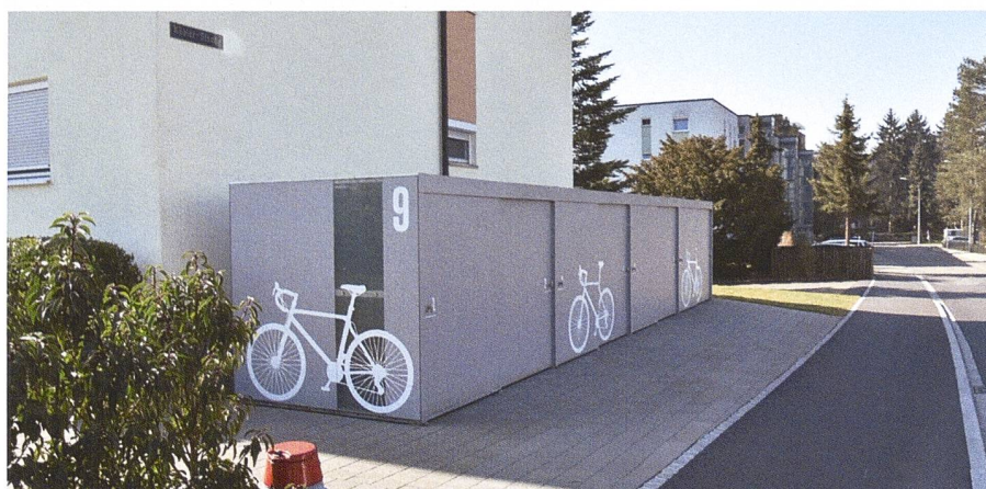
Velogarage Wohnbaugenossenschaft Kohlplatz, Rheinfelden

Zahlreiche Innovationen von Velopa unterstützen smarte Umgebungen in Wohnarealen und vereinen Konnektivität, Digitalisierung sowie Nachhaltigkeit. So laden moderne Sitzbänke auf Wunsch über ihre Solarpanels Smartphones auf und versorgen die eingebauten WLAN-Zugangspunkte mit Strom. Grössere Veloparkieranlagen lassen sich bei Bedarf mit einem Reservations- und Navigationssystem zu den einzelnen Abstellplätzen ausstatten oder mit Ladestationen für E-Bikes ergänzen.