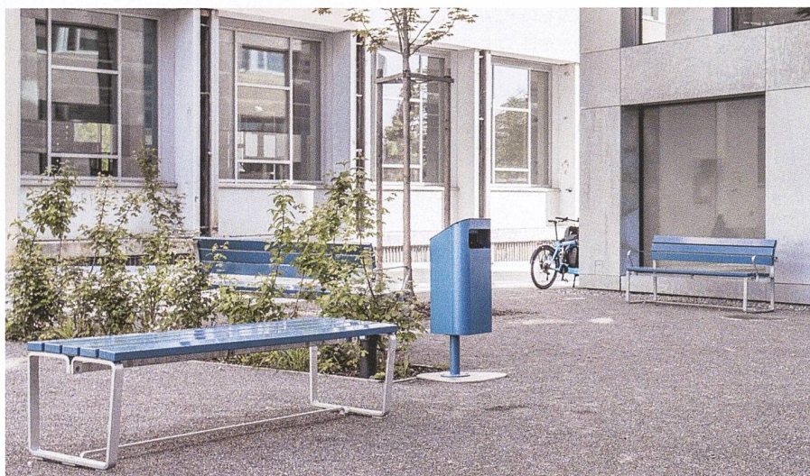
Sitzbank Toya und Abfallbehälter Kondo, Genossenschaft Hammer, Zürich

Über Jahrzehnte hat sich Velopa mit Infrastrukturlösungen für die ressourcenschonende Mobilität einen Namen gemacht. Dazu gehört heute ein vielfältiges Sortiment an digitalen und mechanischen Veloparkiersystemen, stilvolle Anlehnbügel, platzsparende Karussell- und Doppelstockparker mit hoher Flächeneffizienz bis hin zu modularen Velounterständen und Absperrlösungen. Mit Mobilitätsökosystemen für den emissionsarmen Verkehr unterstützt Velopa zudem die Mikromobilität in der unmittelbaren Umgebung des Wohnareals sowie bis zum nächsten Mobilitäts-Hub mit Anschluss zum öffentlichen Verkehr. Für den weitergehenden Mobilitätsbedarf der Wohnungsmieterinnen und -mieter stellt das Unternehmen komplette Sharing-Plattformen mit E-Fahrzeugflotten bereit.