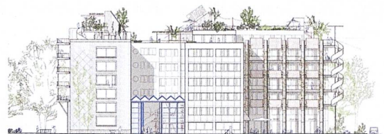
Herzstück der Umnutzung soll eine neue zweigeschossige «Halle für alle» sein, die die zwei Gebäudeteile verbindet und Bewohnenden sowie Quartier offensteht.