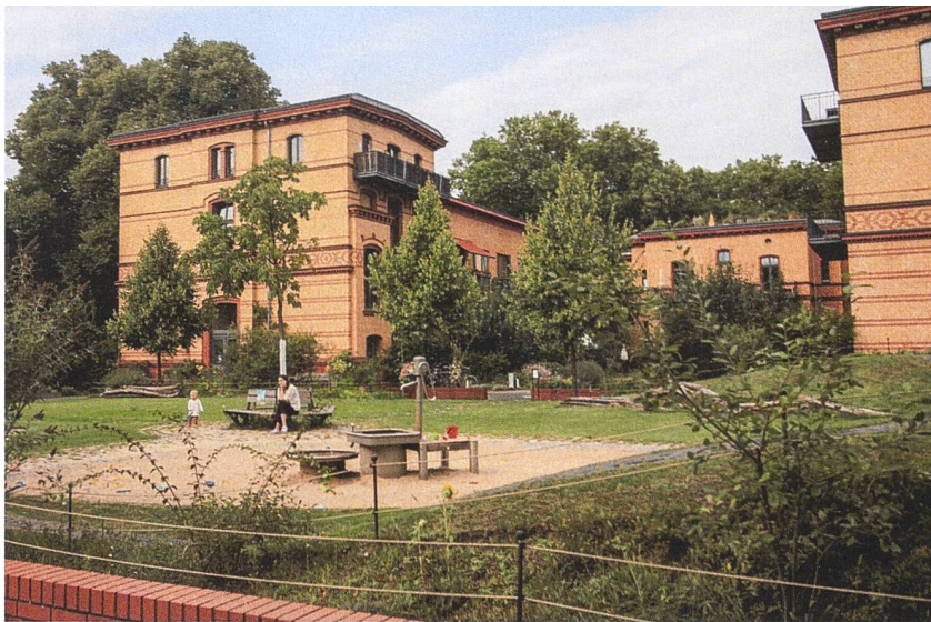
Böse Zungen bezeichnen das autofreie Ensemble als Insel für Besserverdienende. Doch im Gegensatz zu früher stehen die Tore heute auch für Auswärtige weit offen.

In Deutschland steht die Baugruppe für bürgerschaftliches Engagement und Teilhabe an der Stadt, die sich vor allem Leute aus der Mittelschicht leisten können. Weil die Grundstücke und Immobilien in Berlin heute dreibis viermal so viel kosten wie noch vor zehn Jahren, können Baugruppenwohnungen heute profitabel weiterverkauft werden. Beim Projekt «Am Urban» hatten die Architekten anfangs 2600 bis 3200 Euro pro Quadratmeter berechnet, am Ende lagen die Preise deutlich darüber. Zwar ist die Fluktuation dort noch sehr gering, wie Gedenk vor Ort erklärte. Aber die Wohnanlage gewinnt auf dem angespannten Berliner Wohnungsmarkt täglich an Wert. ➔