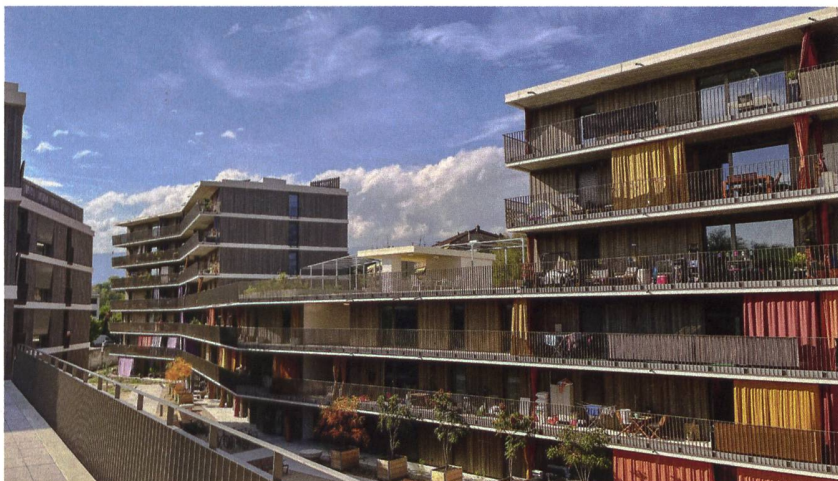
Dank der geknickten Gebäudevolumen wirkt die dicht bebaute Siedlung nicht einengend. Die Wohnhäuser verfügen über eine tragende Betonstruktur und holzverkleidete Fassaden.