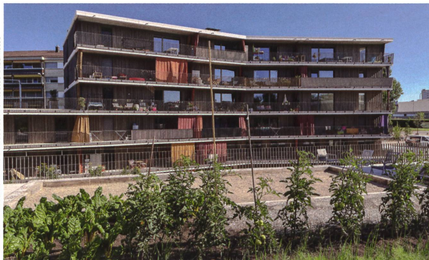
Bilder: Farra Zoumboulakis & Associés Architectes Urbanistes

Getreu ihrem Credo entfaltet die Codha in ihrem Wohnprogramm eine ganze Palette von Wohnungstypologien, um einen möglichst grossen sozialen und generationenübergreifenden Bewohnermix zu erreichen. Zu den Zweieinhalb- bis Fünfeinhalbzimmerwohnungen kommen vier Clusterwohnungen mit sechs bis sieben Zimmern hinzu, die um eine grosse Küche angeordnet sind, die sich wiederum zu einem zentralen Wohnbereich hin öffnet. Gästezimmer, die je nach Bedarf gebucht werden