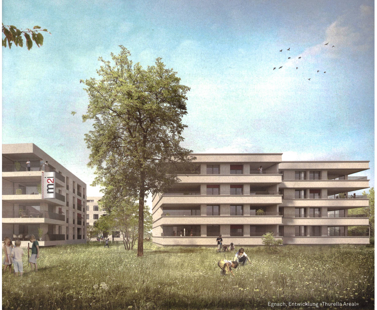
Egnach, Entwicklung «Thurella Areal»