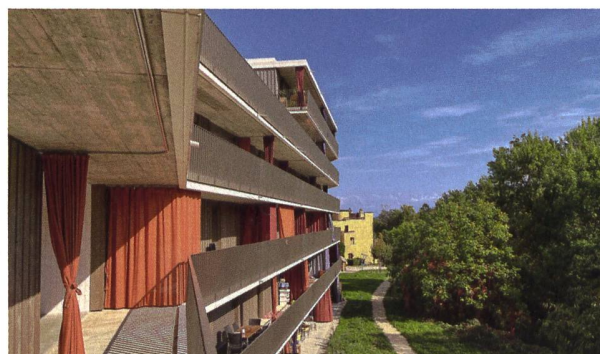
Auffällig sind die bunten Aussenvorhänge auf den Laubengängen. Sie dienen als Schattenspendler.