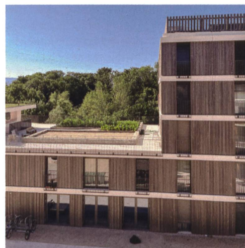
Zu den Gemeinschaftsflächen gehören ein Quartiersaal, Ateliers, Musikzimmer und zwei Dachterrassen. Auf ihnen können die Bewohnerinnen und Bewohner sogar Gemüse anpflanzen und Boule spielen.