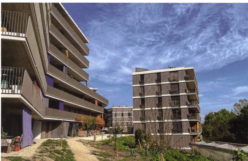
Blick ins Grüne: Die Siedlung liegt direkt gegenüber einem Wald, auch ein Gemeinschaftsgarten gehört dazu.