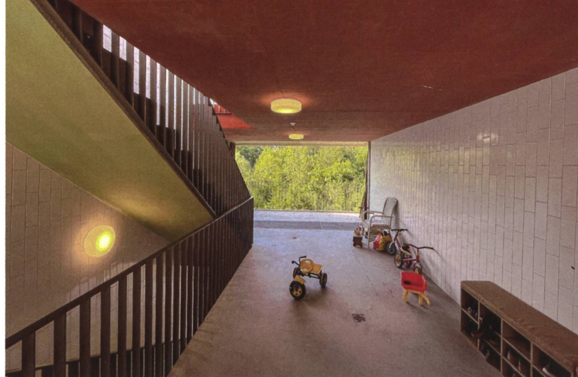
Bilder: Farra Zoumboulakis & Associés Architectes Urbanistes