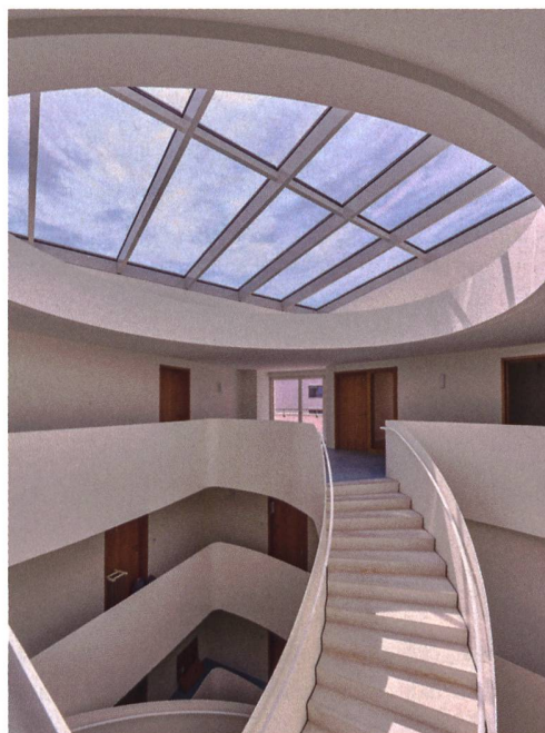
Farbenfroh und lichtdurchflutet: Alle Wohnhäuser sind als Vierbis Sechsspänner konzipiert und weisen ein zentrales Treppenhaus auf.

In den Erdgeschossen der Wohngebäude bestehen die Fassaden aus Betonfertigteilelementen, darüber liegen die verputzten Regelgeschosse. Die beiden Obergeschosse wurden als Mansardendächer ausgebildet. «Als Referenz an die Geschichte des Areals mischten wir Glasgranulat in den Aussenputz. Darum schimmern die Fassaden je nach Sonneneinfall in verschiedenen Farben», sagt Runggaldier. Damit die Bewohnenden die hohe Dichte nicht als bedrückende Enge empfinden, liessen sich Duplex Architekten etwas einfallen. «Um die Kompakt-