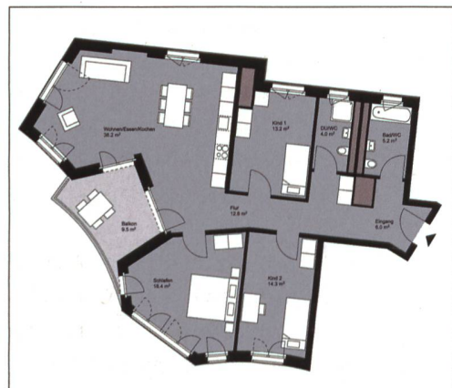
Beispiel einer 4 ½-Zimmer-Wohnung der BGZ mit 110 Quadratmetern. Viele Wohnungen weisen spannende, ungewöhnliche Grundrisse auf.

5 ½-Zimmer-Wohnung, 115-123 m 2 : 2240 bis 2320 CHF plus 170 CHF NK CHF 17 000 Anteilscheinkapital