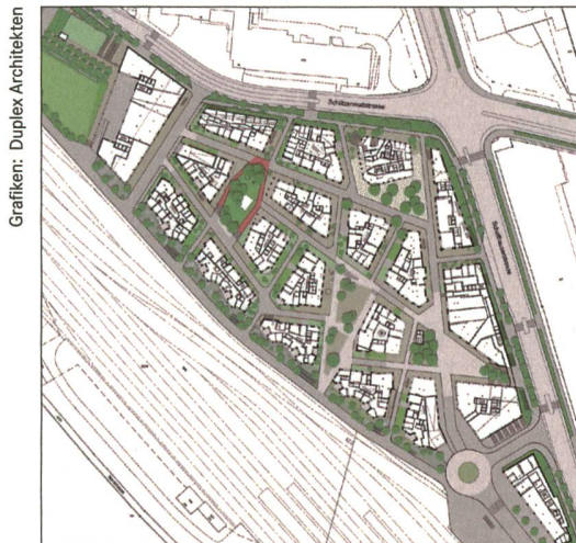
Grafiken: Duplex Architekten

Die beispielhafte Transformation des Glasi-Areals von einem Industrie- in ein Wohnquartier zeigt, dass Dichte und Vielfalt keine Gegensätze sein müssen. Doch wie kann ein lebendiges Miteinander gelingen, eine «Schlafstadt» vermieden werden? «Mit der Wahl des städtebaulichen Konzepts von Duplex Architekten