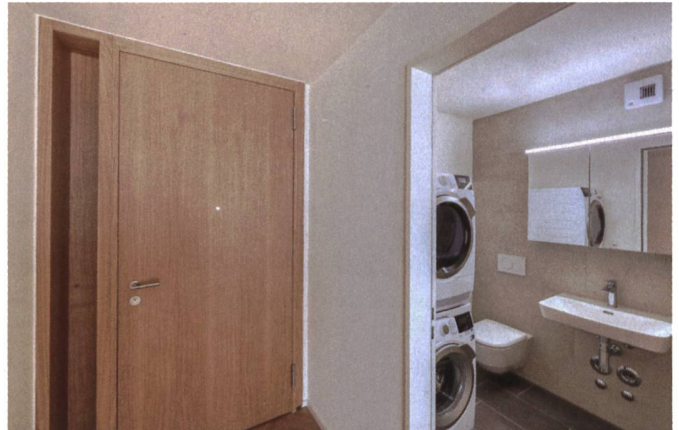
In den Häusern Elena und Karina der Logis Suisse wurde Riemenparkett aus Buche und Eiche verlegt. Im Haus Elena weisen die Küchen ein Fenster zum Treppenhaus auf. Damit sollen die innen liegenden Küchen belichtet und das nachbarschaftliche Miteinander gefördert werden.

heit aufzulockern, arbeiteten wir mit Blickbezüge. Von jedem Punkt aus hat man einen Blick auf einen der vier Plätze, das Guss-Areal oder auf die Bahngleise. Ausserdem sorgen die Mansardendächer für mehr Licht im Quartier», so Runggaldier. «Sie lehnen sich etwas nach hinten und holen sozusagen den Himmel nach unten.»