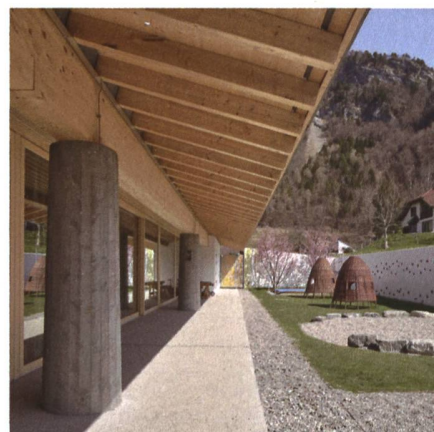
Die ganzflächig integrierte Photovoltaikanlage «Sunskin Roof» von Eternit erfüllt sowohl die architektonischen als auch die ästhetischen Anforderungen der Heimatschutzgemeinde Fläsch und produziert jährlich 179 700 kWh.

2021 konnten Bearth & Deplazes Architekten diese Auszeichnung für ein Mehrzweckgebäude in Fläsch entgegennehmen. Schon zum dritten Mal wurden sie mit dem renommierten Preis ausgezeichnet, der für diejenigen Solarbauten vergeben wird, die aus architektonischer Sicht überzeugen, einen schonenden Umgang mit Ressourcen berücksichtigen und in Bezug auf Nachhaltigkeit so konzipiert sind, dass sie mehr elektrische Energie gewinnen, als sie selbst nutzen.