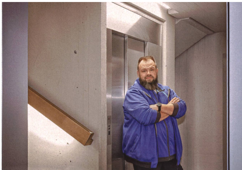
In der Siedlung Luegisland wurden in den Treppenhäusern intelligente LED-Leuchten montiert. Der Energieverbrauch ist um achtzig Prozent gesunken. Ein weiterer Pluspunkt: Die Hauswarte haben kaum mehr Aufwände für Reparaturen.

hängig vom Verkaufsverbot eine sinnvolle Massnahme – in Zeiten hoher Strompreise sowieso.