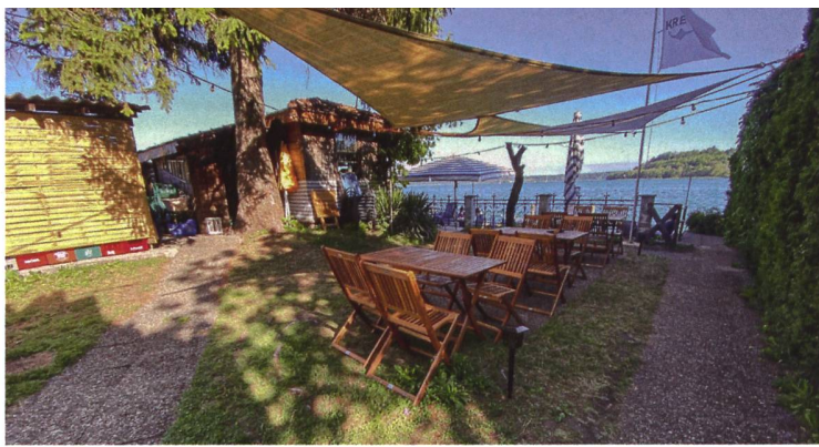
Das Seebistro auf dem Gartengrundstück ist im Sommer sehr beliebt. Der restliche Seegarten steht nicht nur den Bewohnerinnen und Bewohnern, sondern auch für kulturelle oder Vereinsveranstaltungen zur Verfügung.

Bausubstanz. Als grösste bauliche Herausforderungen beim Kreuz nennt sie die bestehende Tragstruktur sowie das bestehende Leitungssystem, die es zu integrieren galt. Da das Erdgeschoss nicht umgebaut wurde, mussten nach ersten Abbruch- und Freilegungsarbeiten die bestehenden Leitungen im Betonboden aufgenommen und je nach ihrer Lage die Nassräume im Grundriss umplatziert und entsprechend angepasst werden. Auch auf das bestehende Treppenhaus mit Lift musste man Rücksicht nehmen: Um die Wohnungen hindernisfrei zu gestalten, war eine Anpassung der Höhe im Korridor notwendig.