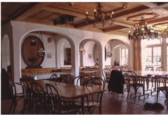
Der Kreuzsaal wird in einer zweiten Etappe renoviert und dient als Gemeinschaftsraum. Er soll zudem Raum für regionale und lokale Kulturveranstaltungen bieten.