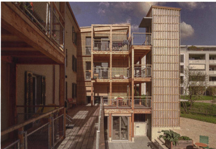
Früher war der Garten nur durch die Kelleretage und die Seiten des Hauses zugänglich, jetzt ist er es auch über die neue Holzveranda und den Lift.