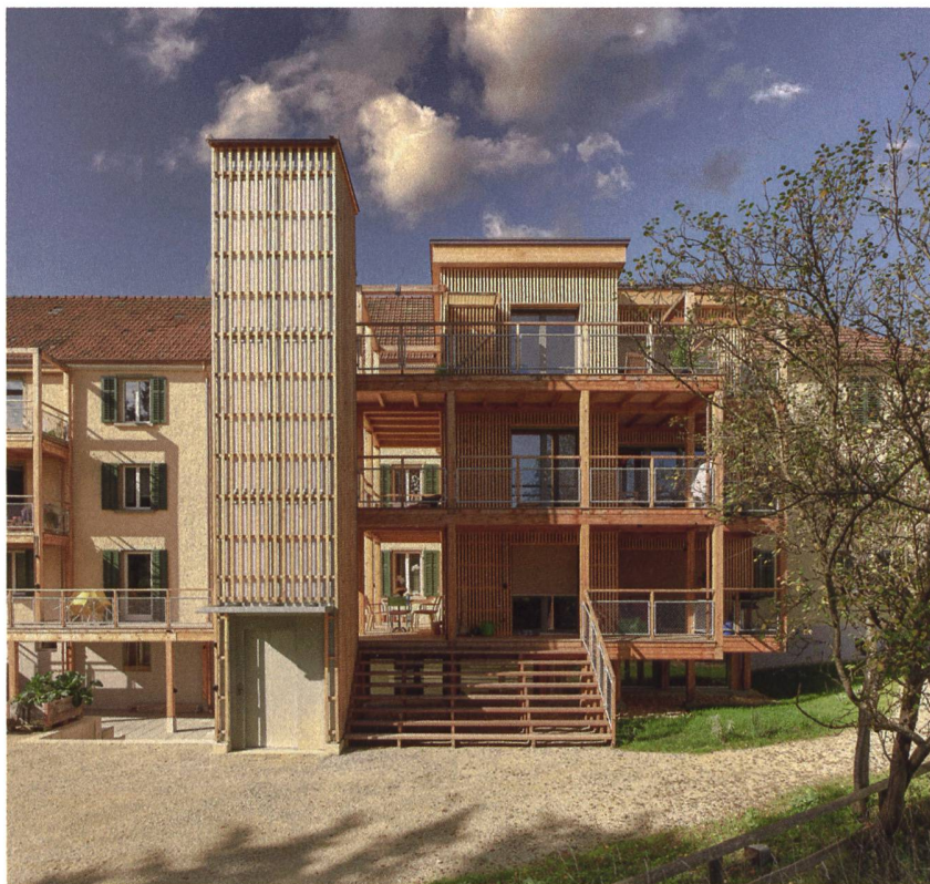
Der gartenseitige Holzanbau mit freistehendem Lift erweitert sechs Wohneinheiten zu grosszügigen, hindernisfreien Familienwohnungen und bietet einen geräumigen Gemeinschaftsraum im Tiefparterre.

Keller zufolge wenig bekannt: «Die Häuser kamen irgendwann zur Stadt. Wie, weiss diese aber nicht mehr.» Saniert worden sei nie, doch habe man die übliche Schindluderei betrieben – Spannteppich, den man auf Parkett leimte, und so weiter. Die Genossenschaft Eins hat den grössten Teil des bisherigen Innenausbaus erhalten respektive wieder hervorgeholt: Den Parkettboden und die Fensterbrettablagen aus Peach Pine Holz, alte Kästen in Küche und Flur, auch die sechseckigen weinroten Kacheln in der Küche, die man von Spezialisten reinigen liess. ➔