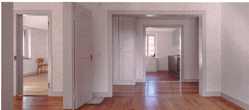
Breite Verbindungen zwischen Küche und Stube schaffen ein grosszügiges Raumgefühl.