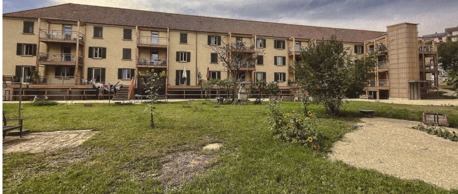
Die Genossenschaft Eins hat das Haus am Schlössliweg in Schaffhausen von der Stadt Schaffhausen im Baurecht übernommen und saniert.

Genossenschaft Eins bezieht in Schaffhausen erstes Mehrfamilienhaus