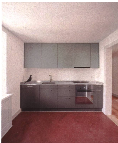
Mit minimalem Eingriff in den Bestand wurden alle technischen Anlagen erneuert und alle Wohnungen mit neuen Küchen und Bädern ausgestattet.