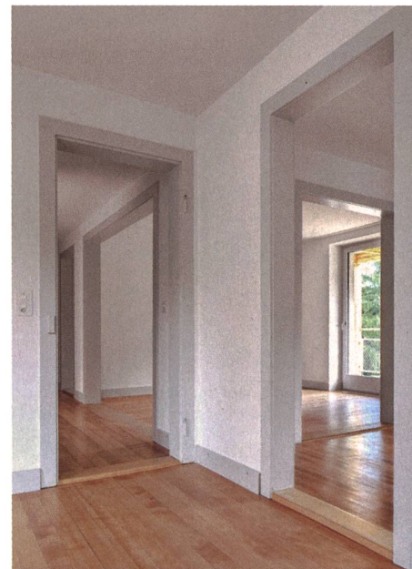
Die noch intakten Elemente aus der Bauzeit wurden, wo es möglich war, erhalten, so dass alte Parkettböden, gestemmte Türen und sechseckige, weinrote Kacheln in der Küche weiterhin das Bild prägen.