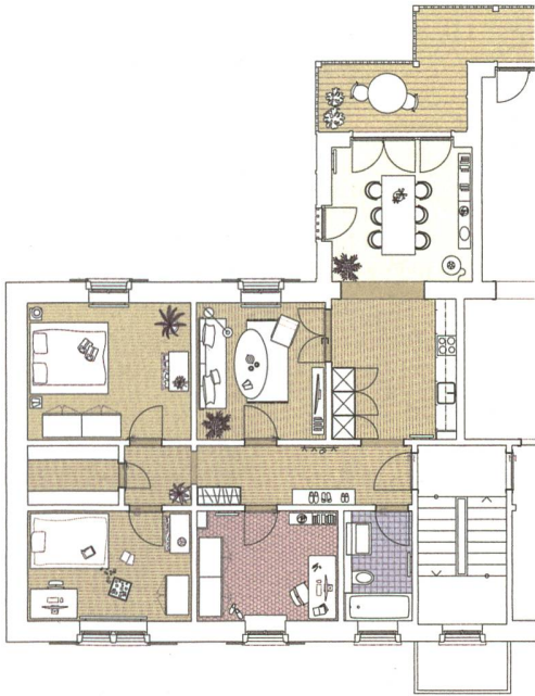
Grundriss einer Viereinhalbzimmerwohnung